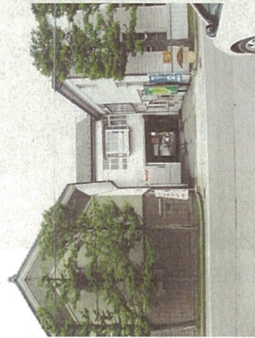
中村征夫写真ギャラリーブルーホール入り口