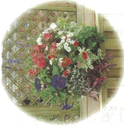
① ハンギングの飾りつけ(目標:1軒1ヶ所≒100カ所+酒蔵20ヶ所)