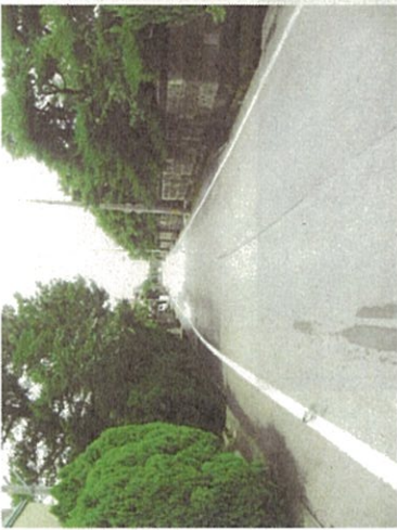
緑が濃い穏やかな通り