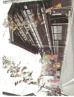
③ セタ笹竹の飾りつけ(目標:1軒1ヶ所≒100カ所)