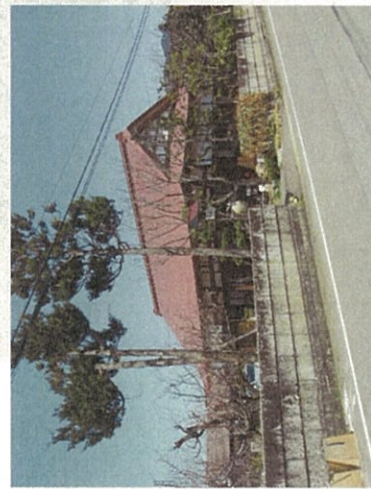
陶芸教室もあり、見学や散策の目的に