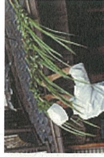
② 端午の節句 菖蒲葺き(小玉家)