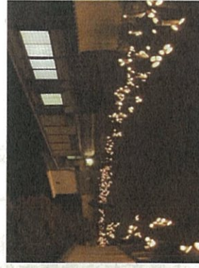
④ お月見に街を蠟燭の火で点すイベントを開催