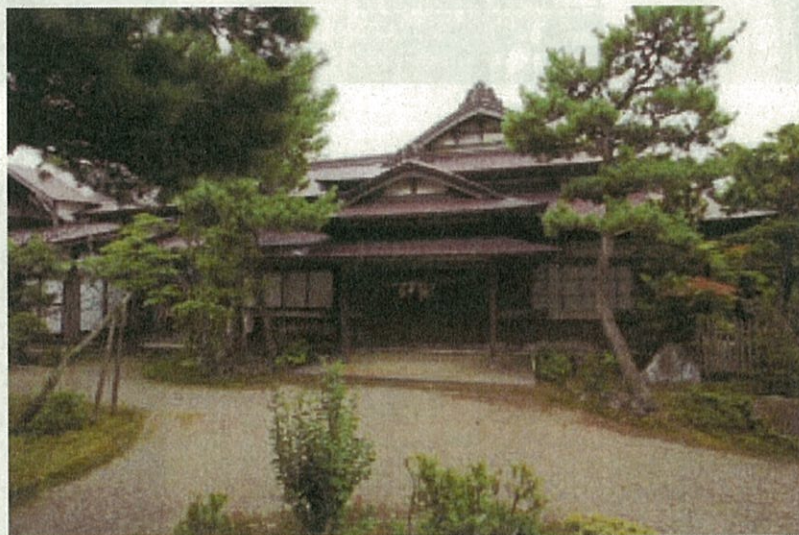
小玉家住宅主屋(正面外観)

小玉家住宅主屋は、吟味された秋田杉の良材や銘木を用いて精緻に施工されており、優れた意匠をもつ近代の和風住宅として価値が高い。また敷地内の3棟の蔵は、近代工法と伝統的意匠を融和させた洗練されたつくりで、地域の近代化を牽引した醸造家の屋敷構えをよく伝えており、庭門及び宅地と併せて保存を図る。