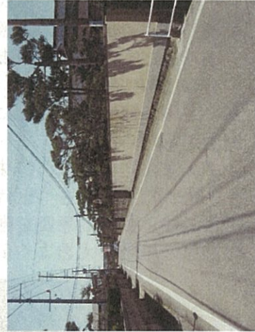
整然とした緑豊かな付まい