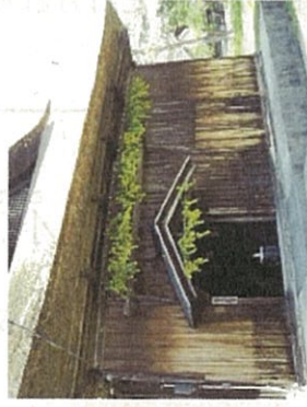
② 軒の山吹の風習(小玉家)