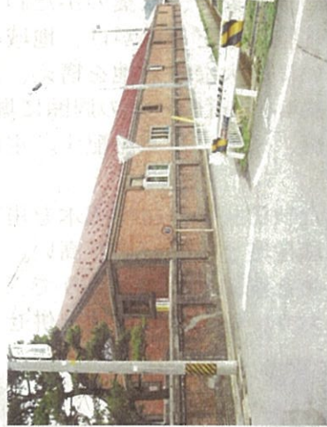
歴史を感じさせるレンガ蔵