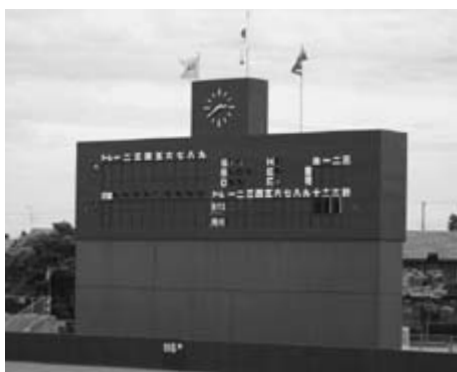
長沼球場バックスクリーン

答 電光掲示板スコアボード、外野フェンスラバー、トイレ改修は財政状況を鑑み、計画的な施設整備として検討します。