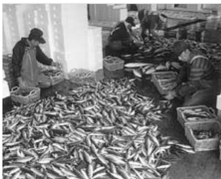
地場産品を販売予定(江川漁港)

答 販売区画は来客者の利便性を考慮し品目陳列方式。賃貸収入は運営会社に対する販売手数料と年会費。テナント料は検討中です。