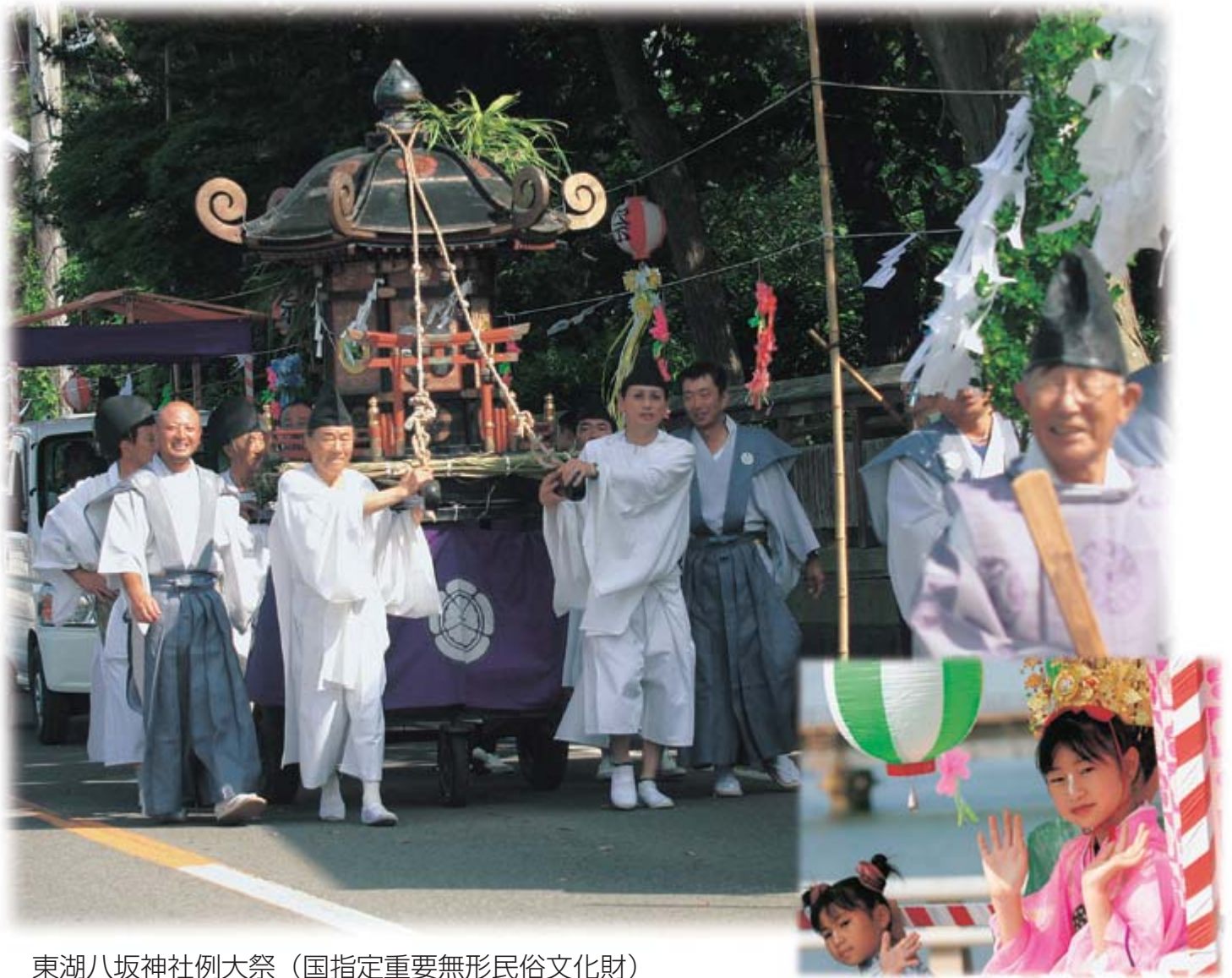
東湖八坂神社例大祭（国指定重要無形民俗文化財）