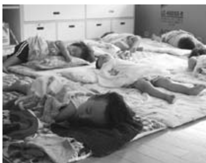
若竹幼児教育センター

問 不妊治療を施す必要があっても膨大な治療費を思うと、どうしても諦めざるを得ないので市として自主的に制度化し、不妊治療融資制度の創設の考えは。