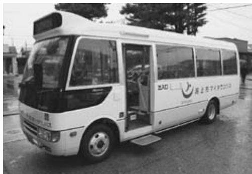
潟上市マイタウンバス

答 本市のマイタウンバス事業は高齢者をはじめとする交通弱者の移動手段の確保を主な目的としてきたが、利用率の低迷から平成21年に運行経路・ダイヤ改正をはかり経費節減を図ってきた。しかし、利用者は依然として減少傾向にあり、ピーク時の10分の1まで落ち込んでいる。県の補助金も減少となり、市の財政負担も大きくなっていることから、今後は全国的に導入が進んでいるデマンド型乗り合いタクシーについての調査を進め、抜本的な見直しをはかりたいと考えている。