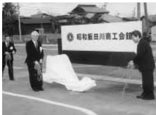
新しい銘板を披露

続いて、職員の辞令交付、職員代表による誓約書奉読などが行われました。その後、潟上市昭和公民館ホールで開所記念祝賀会が開かれ、新たな門出を祝い合いました。