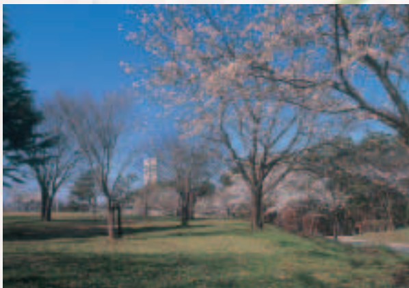
天王グリーンランド・出戸浜いこいの森

「天王グリーンランド」「出戸浜いこいの森」では、4月中旬頃から園内に桜が咲き誇ります。約20ヘクタールの広さをもつ出戸浜いこいの森は、日本レクリエーション協会公認コースとして知られ、ウォーキングや散策、ピクニックに最適です。