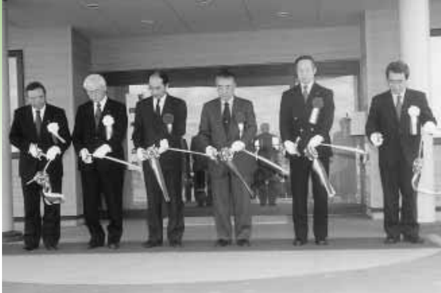
テープカットで開所を祝う