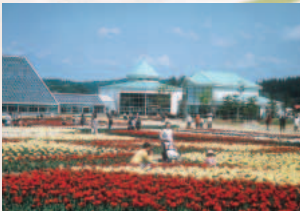
ブルーメッセあきた

「天王グリーンランド」「出戸浜いこいの森」では、4月中旬頃から園内に桜が咲き誇ります。約20ヘクタールの広さをもつ出戸浜いこいの森は、日本レクリエーション協会公認コースとして知られ、ウォーキングや散策、ピクニックに最適です。