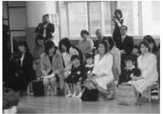
今日からみんなお友だち（若竹幼児教育センター）