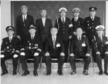
小玉市長職務執行者を囲んで記念撮影