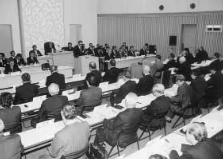
潟上市初の市議会臨時会（昭和庁舎議場）