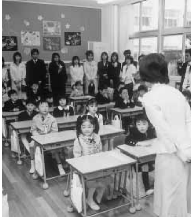
先生のお話、ちゃんと聞けるヨ（天王小学校）