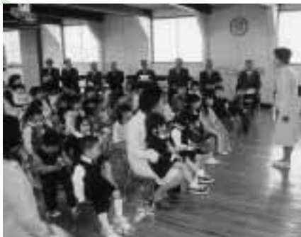
友だちいっぱい作るゾ（昭和西保育園）