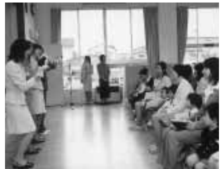
保育園は楽しいことがいっぱい！（追分保育園）