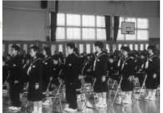
心晴れやかに新たなスタート（天王中学校）