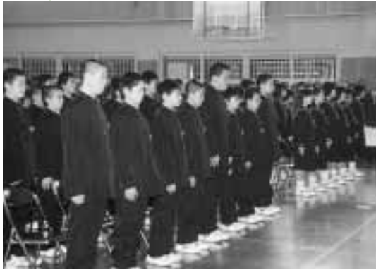
中学校生活に夢と希望をもって（羽城中学校）

各式では新入生らが緊張の面持ちを見せながらも、新しい世界に胸を弾ませていました。