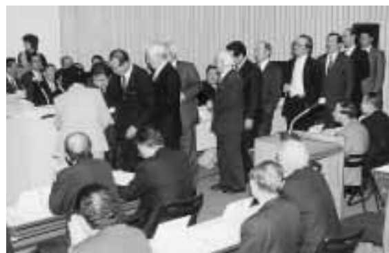
新議長の選挙風景