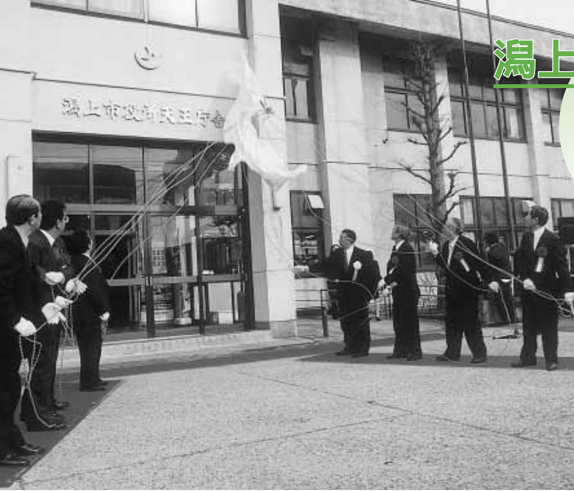
潟上市役所天王庁舎