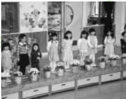
大きな声で歌えたヨ（昭和東保育園）