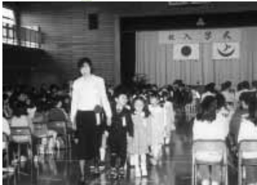
“心ウキウキ” 小学校生活（飯田川小学校）