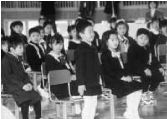
「ハイ！」元気にあいさつできました（大久保小学校）