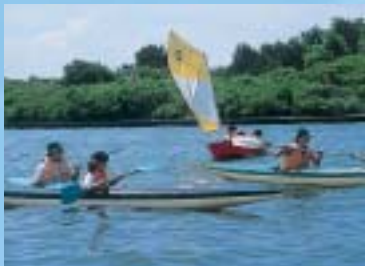
天王海洋センター「艇庫」

遠くに男鹿の山々や鳥海の霊峰が一望でき、日本海に沈み行く夕日は迫力満点。遠浅で泳ぎやすく、夏にはたくさんの家族や若者で賑わいます。