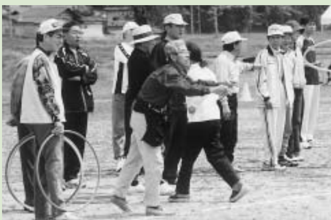
新しいまちづくり、地域づくりが始まる

私の政治姿勢として、新市「潟上市」においても堅持していくべきは「現場主義を旨とした市民の目線にたった行政運営」ということとであります。今後とも地域代表者のみなさんには、よろしくご指導、ご鞭撻をいただきますよう、重ねてお願いいたします。