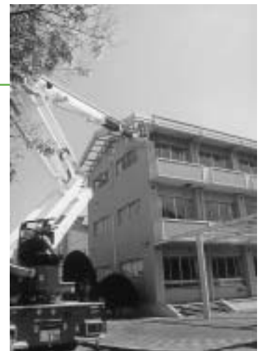
高所救助車が登場！