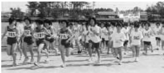
中学生ランナーが勢ぞろい