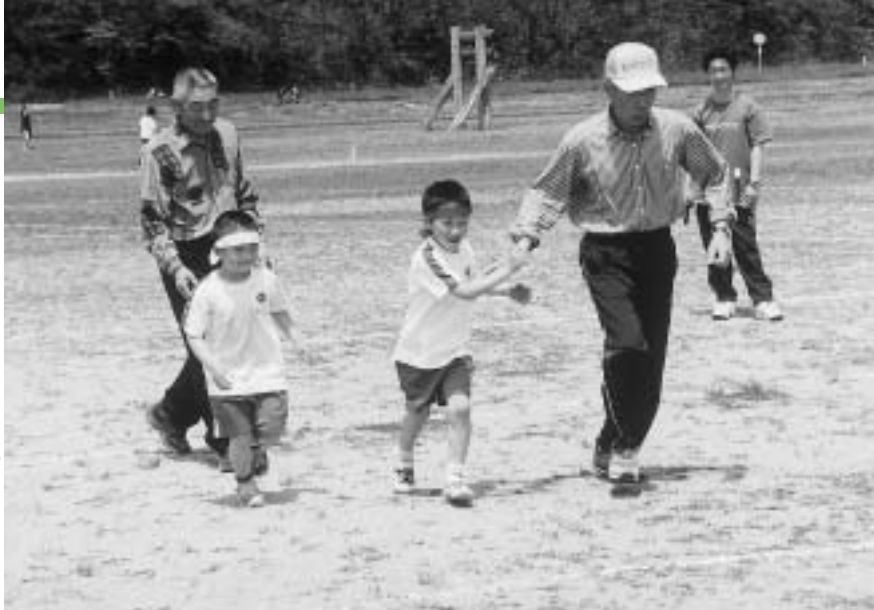
▶手に手をとって 仲良く「ゴルフ」(豊川小)