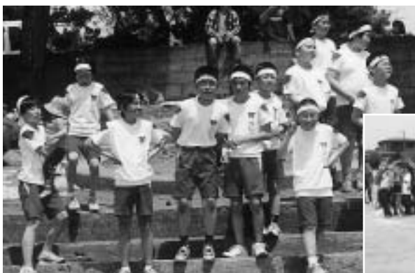
次代を担う子どもたちへ

このほかの協議事項では、市から八郎湖クリーンアップ作戦「秋田わか杉国体」「みんなの登校日」などについて協力依頼などがあり、行政と地域が手を携えて、より連携を密にしていくことを確認しました。