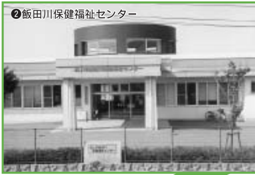
② 飯田川保健福祉センター