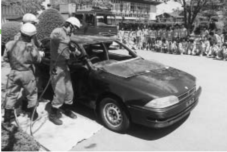
事故車両から迅速な作業で人命を救助