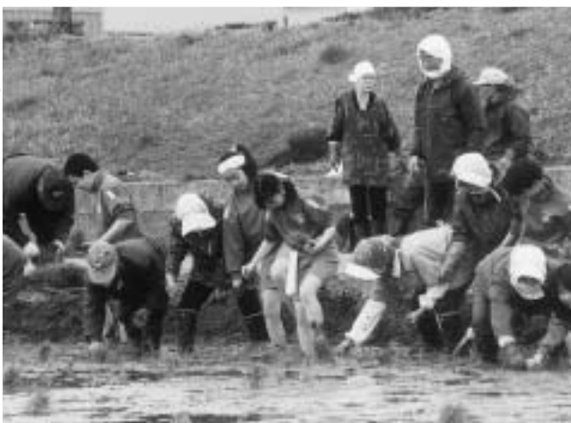
▶地域の人たちと一緒に田植え作業する小学生

この活動は、昨年の秋田県学校農園展で見事「最優秀賞」を受賞しています。今年も、農作物の栽培研究を学びながら、「農園展の連覇」を目指して生き生きと活動しています。