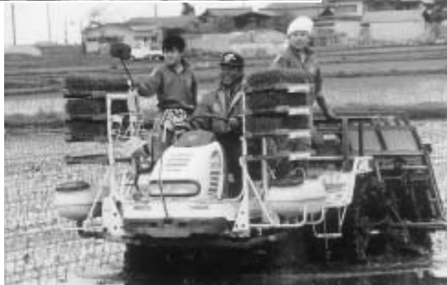
▶「ドキドキ・ワクワク」田植機「乗車」