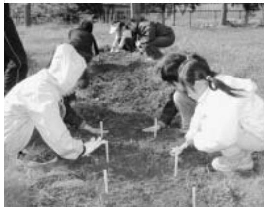
豊川小児童のみなさん