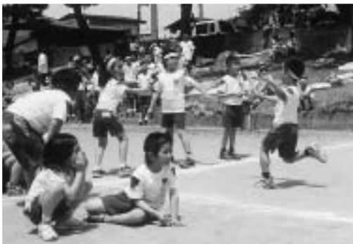
▶みんなの心を一つに (東湖小)