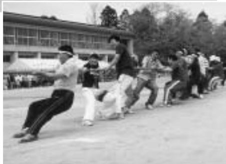
▶地域の力を集結 (天王本郷会)