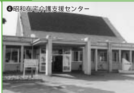
④ 昭和在宅介護支援センター