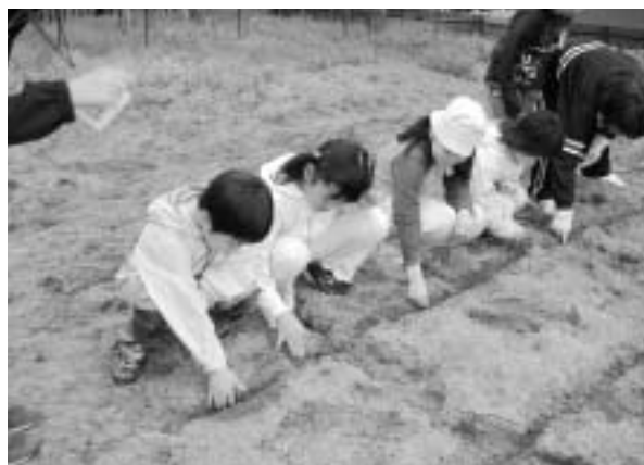
大久保小児童のみなさん

五月十八日にスタートしたほうかご元気塾は大久保、豊川あわせて六十二人の子どもたちが参加しています。今回は「かぼちゃ」と「ひまわり」の栽培に挑戦しました。大きなかぼちゃが育つように