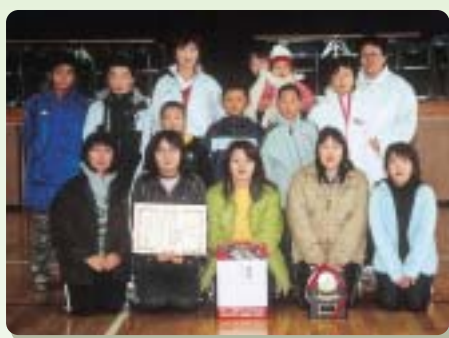
女子の部優勝「船橋」チーム

昨年12月11日、第1回潟上市綱引大会が、潟上市昭和体育館を会場に行われました。