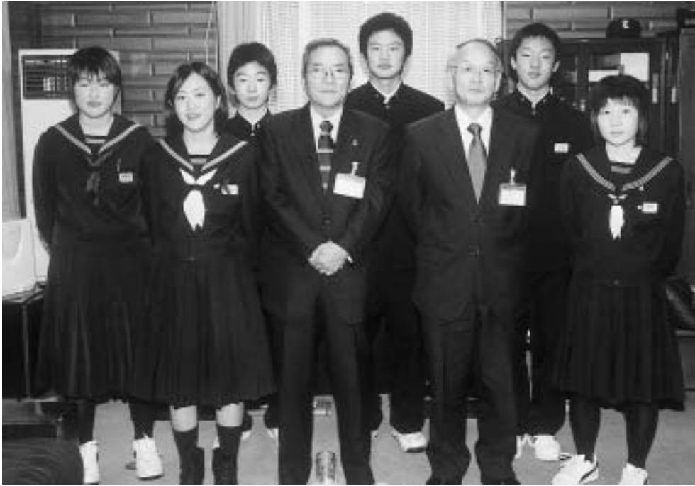
石川市長、小林教育長と中学生が新年の抱負を語る