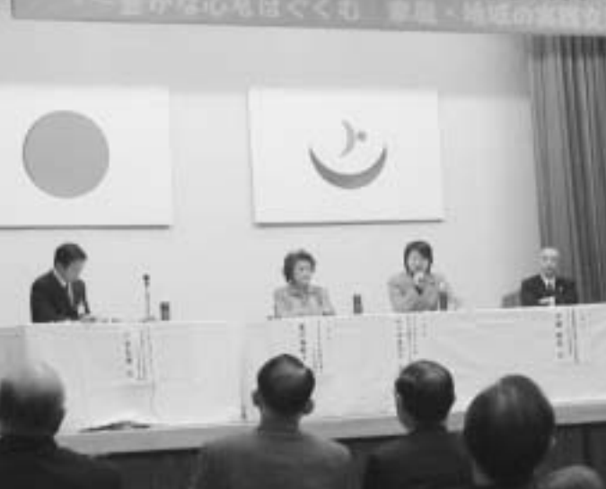
参加者を交えて意見交換