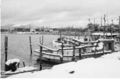
雪に包まれる江川漁港（天王地区）