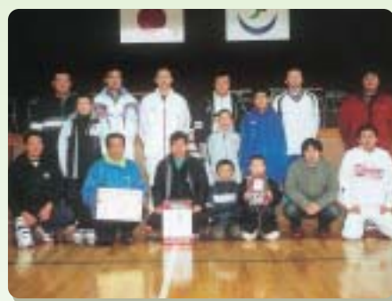
男子の部優勝「船橋」チーム

競技終了後は、公開競技として全県大会出場の常連である船橋チーム(8人)が、会場の腕自慢13人と綱引きを行い、船橋チームのリズムは、一瞬の乱れもなく圧勝し、会場から大きな歓声が上がりました。