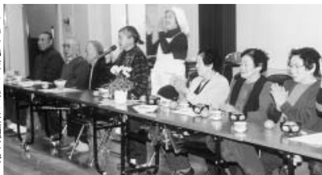
おいしいだまこ餅に笑顔が広がる