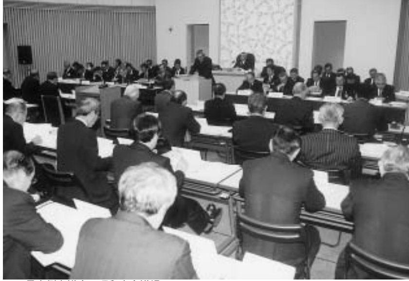
12月定例会市議会（昭和庁舎議場）