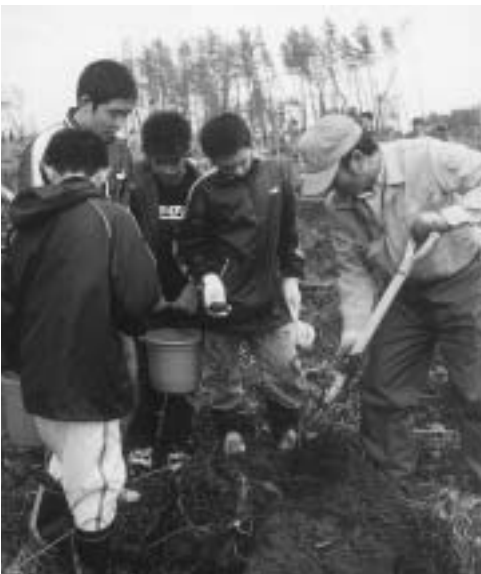
緑豊かなふるさとを願って