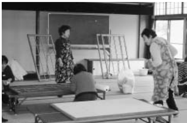
日頃の感謝を込めてボランティア活動