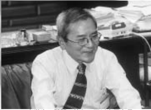
中学生の質問に答える石川光男市長