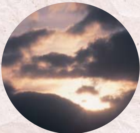
2006年初日の出と共に、新しい一年が始まる