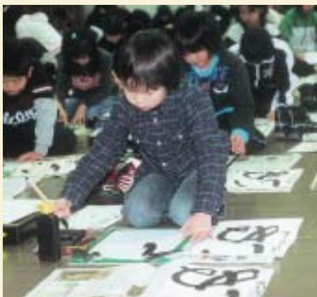
心を静めて書初めに挑戦する小学生(半紙の部)