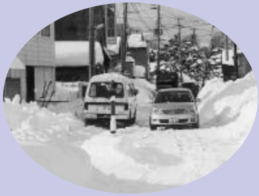
狭くなった市道では、ドライバーが譲り合い慎重な運転に。