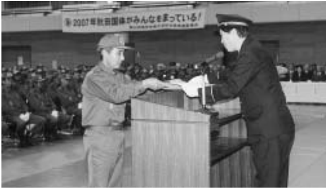
長年の労を称える