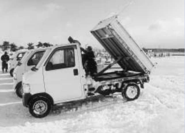
家族総出による除排雪作業が続く。