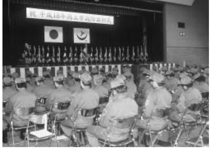
新しい団旗・分団旗が登壇。新春に防火・防災を祈願。