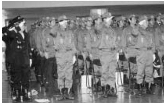
3支団30分団が勢ぞろい！