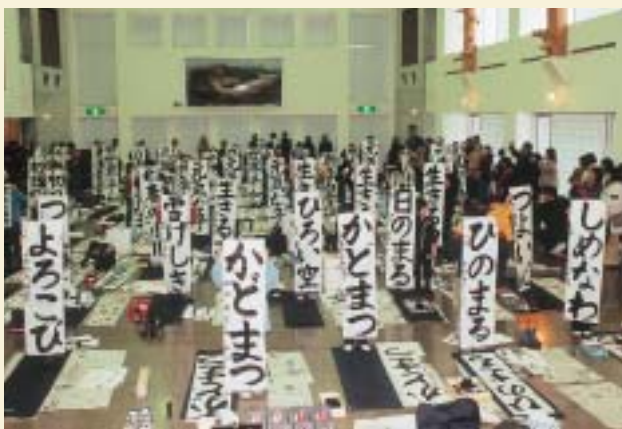
完成した作品の数々(条幅の部)

この日書かれた作品は、一月十二日まで鴻上市昭和公民館に展示され、好評を得ていました。