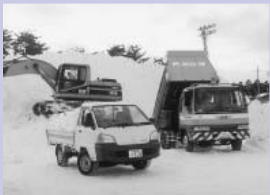
連日、運び込まれる排雪で大きな「雪の山」が...