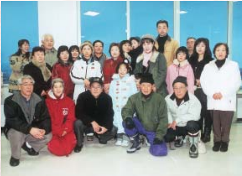
石川市長を囲んで市民多数が新年を祝い合う