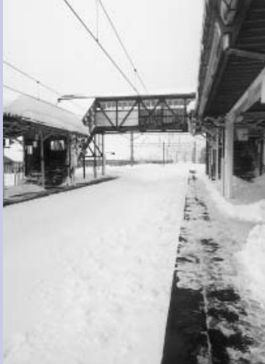
1月5日、市内のJR各駅は大雪のため完全にストップ。市民の足に大きな打撃を与えました。