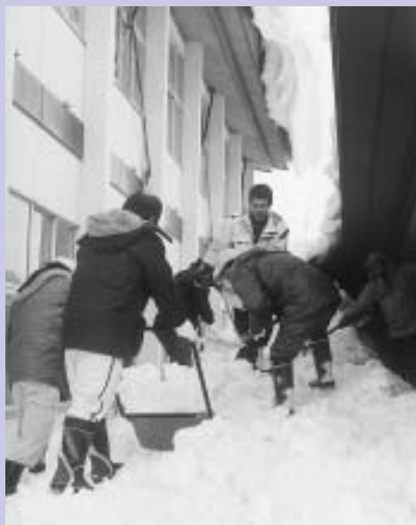
市職員による除雪作業が、休日を返上して行われています。