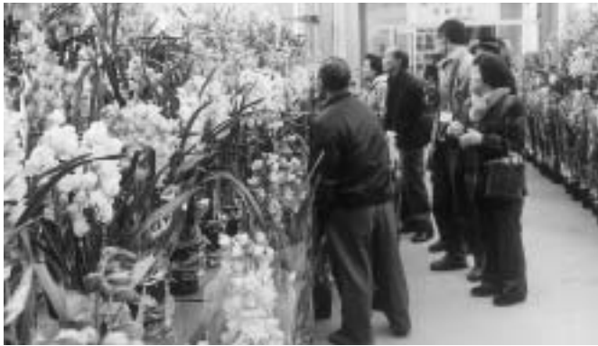
色鮮やかな蘭が勢ぞろい!