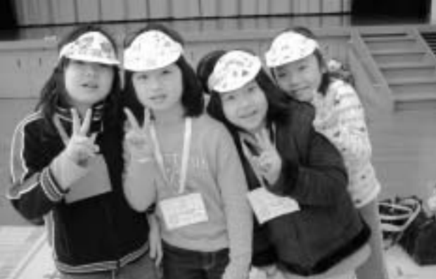
自作のサンバイザーが完成し、「ピース」

作り方を指導してくれたのは、羽城中学校の生徒たち。遊び回る子どもたちを手際よく手伝っていました。