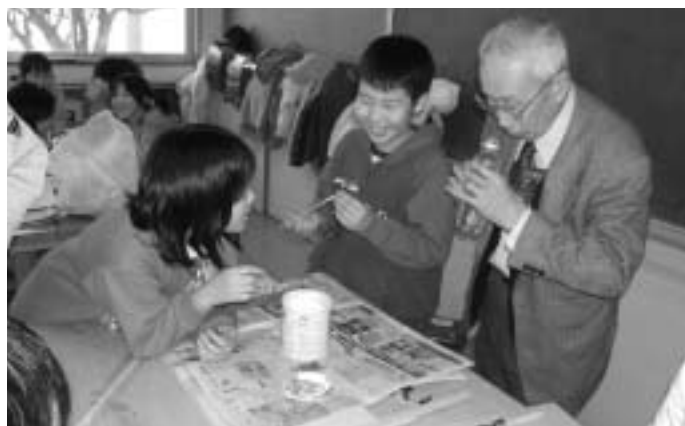
創作活動から豊かな感性を育む