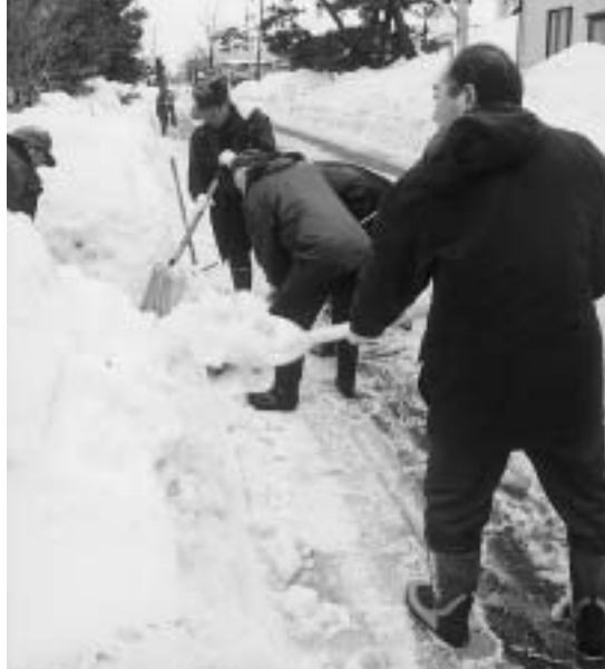
各自治会では市民が力を合わせてごみ集積所などの除雪に汗を流しました