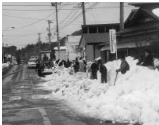
自治会と業者が連携し、通学路の安全確保に一斉排雪

一月十四日・十五日と二十一日の三日間、各自治会では、市からの呼びかけに応え、『市内一斉除排雪デー』を実施しました。