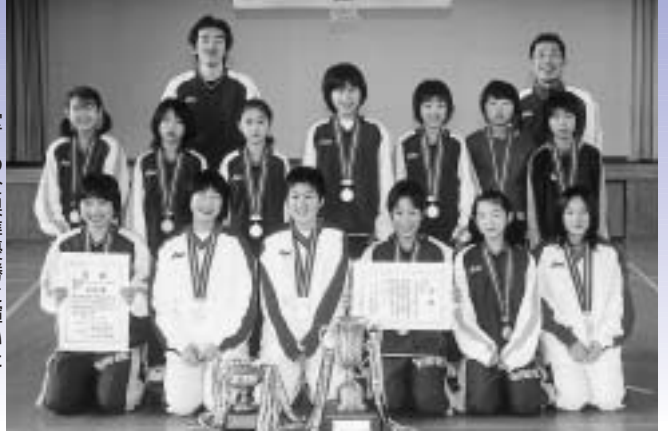
堂々の全県準優勝に輝いた大久保女子ミニバスのみなさん