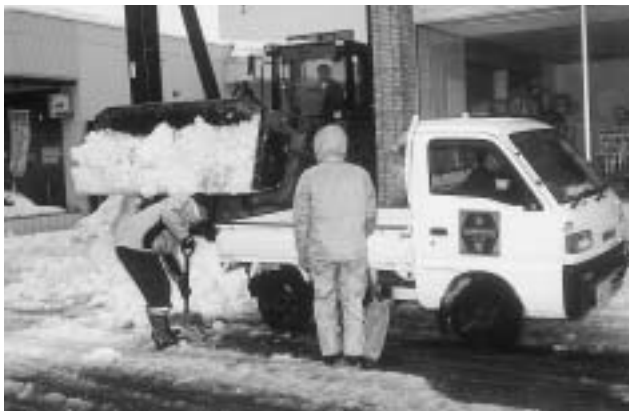
除排雪には重機、トラックがフル回転！