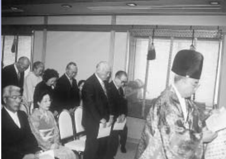
大厄・還暦などを迎えた市民が参加