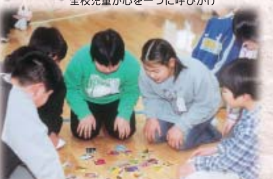
2月1日、「天王小130周年祝い集会」で、かると大会の決勝戦がありました。このかるとは創立130周年を記念して制作したものです。

アトラクション「ようこそ先輩」では、天王中学校吹奏楽部による記念演奏会が行われました。最後は「ふるさと」を列席者全員で合唱し、歴史の節目を祝い合いました。