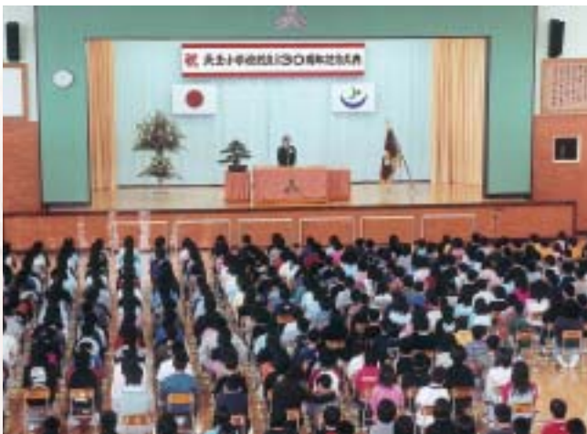
創立130周年をみんなで祝う