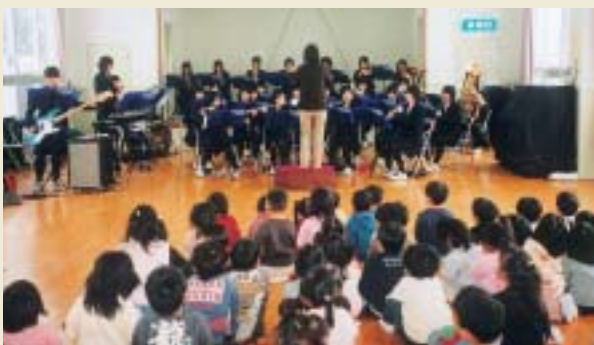
秋田西高吹奏楽部による演奏会