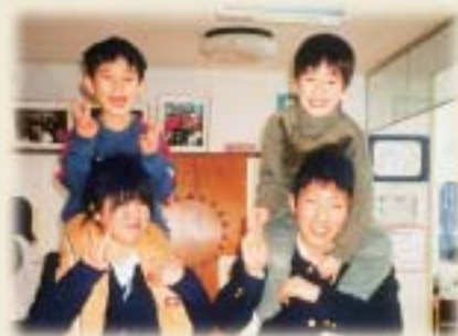
高校生と園児が仲良く「ピース..」

秋田西高校吹奏楽部が 追分保育園を訪問 「アニメソングを披露し、和やかに交流」 先ごろ、県立秋田西高校(校長 永田剛)の吹奏楽部員が追分保育園を訪れ、二歳児から五歳児までの園児たちと交流を深めました。 同校では、これまで家庭科授業やボランティア活動、部活動の一環として、保育園行事に参加し、園児との交流を広げてきました。 この日は、吹奏楽部員三十一人が「キラキラ星」「ドラえもん」「アンパンマン」など、子どもたちがよく知っているアニメ曲など、息の合った演奏を披露。子どもたちは、本物の楽器の音色に驚きながらも、軽快なリズムに体を動かしたり、歌ったり、笑顔で聴き入りました。 終了後は、高校生から年賀状、園児からカレンダーのプレゼント交換が行われました。子どもたちは、高校生と肩ぐるまやおんぶ、かくれんぼなどでふれあい、満面の笑みを見せていました。