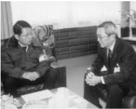
▶二月八日、平野昭東北農政局長が本市の雪害状況を視察し、石川市長と面談