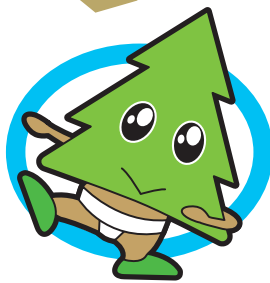
相撲競技 (天王地区)