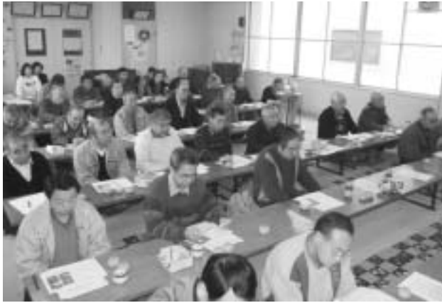
多くの住民が参加した下虻川地区