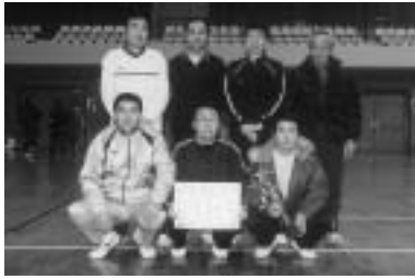
壮年の部優勝「天王」