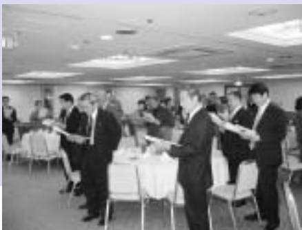
▶ふるさとの発展を願い心を一つに合唱