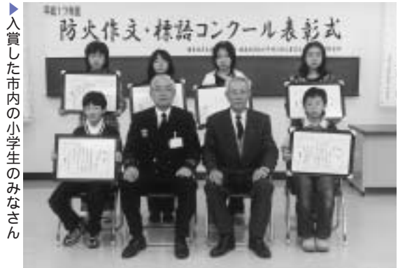
▶入賞した市内の小学生のみなさん