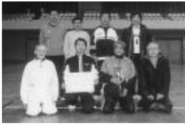
男子の部優勝「出戸新町A」