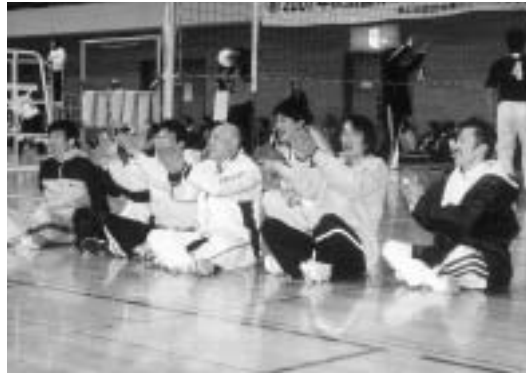
家族・友人の応援が飛び交う