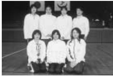
女子の部優勝「追分」