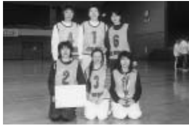
主婦の部優勝「出戸新町A」

市が主催する「第一回潟上市家庭バレーボール大会」が、二月十九日、潟上市天王総合体育館を会場に行われました。 市民の健康づくりと地域の融和・親睦を深めることを目的に、記念となる今大会には各町内会や分館などで構成された五十二チーム