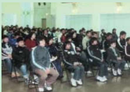
小中学生たちが熱心に聞き入る