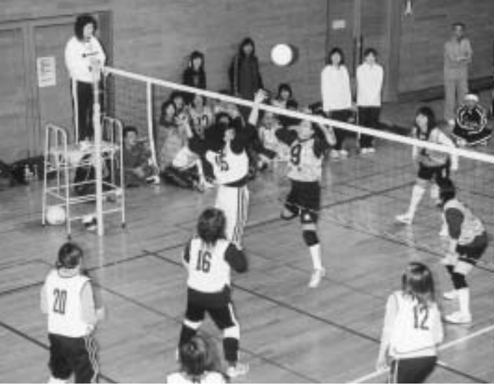
男女ともに好プレーが続出！