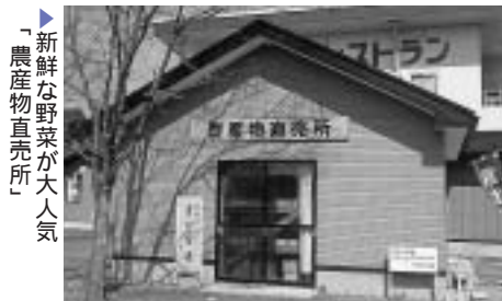
新鮮な野菜が大人気 「農産物直売所」

お問い合わせは...道の駅てんのう(☎878-6588) 潟上市都市整備課(☎855-5119)