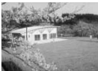
二荒山グラウンドゴルフ場