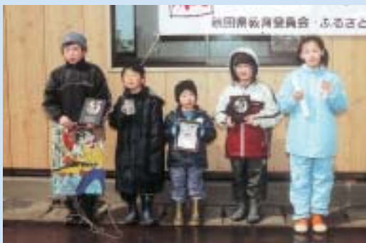
子供の部で入賞した子どもたち、ヤッター!