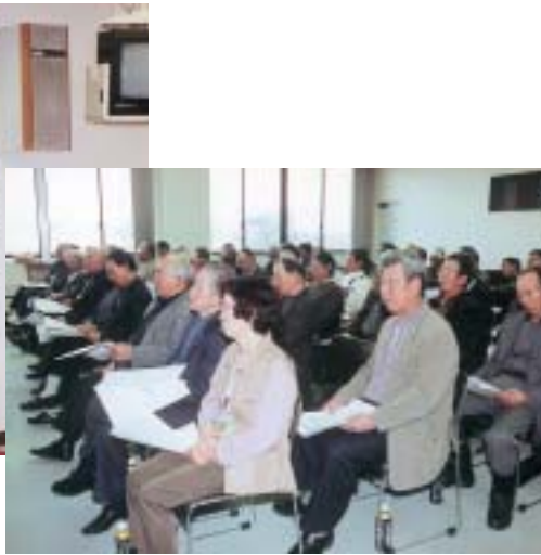
活力ある地域づくりをめざして