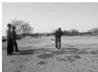
グランパスくらかけ