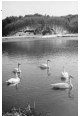
白鳥とふれあうことができる 金山親水公園(大堤)

丘陵の高台に建つ東屋からは、遠くに男鹿の山々や夕日に輝く八郎湖が一望でき、豊かな田園風景が広がります。