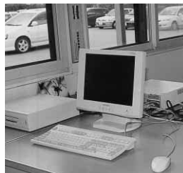
事務室にはパソコンを配置