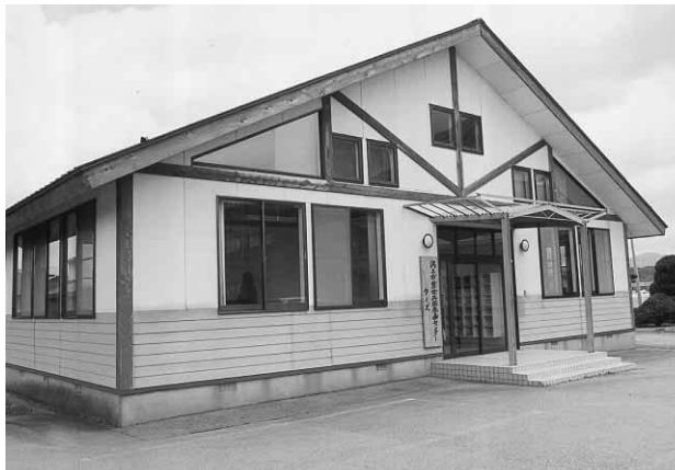
潟上市男女共同参画センター「ウィズ」