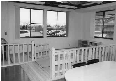
学習室には子どもが遊べる託児スペースを設置