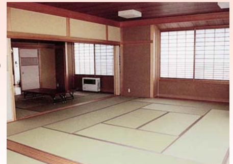
広々とした和室が好評です