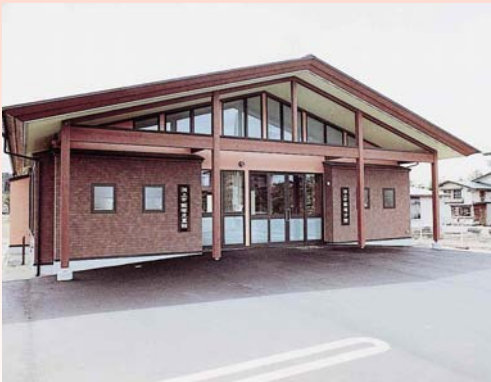
飯塚分館・児童館