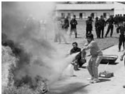
各家庭では初期消火が大切です （昨年の防災訓練から）

内各地で大規模な被害を受け、から二十三年が経ちました。災害は忘れたころにやってきます。この機会にいろいろな防災訓練を体験してみてください。いかがでしょうか。