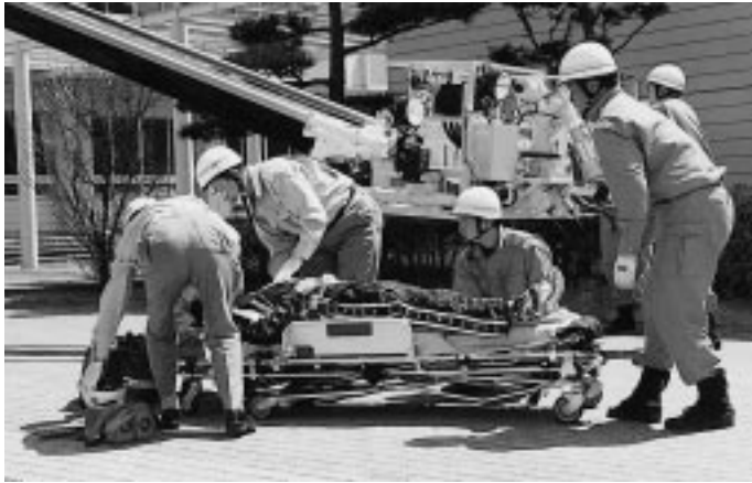
本番さながらの救助訓練（昨年の防災訓練から）