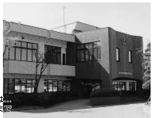
潟上市役所飯田川庁舎