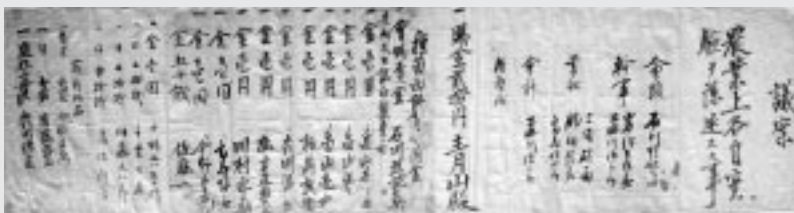
(写真は、潟上市郷土文化保存伝習館に所蔵されている『種苗交換会手続』(上)と『議案』(下))

補足『種苗交換会』という名称が使用されたのは明治15年からです。明治11年に開催された「第1回勸業会議」が記録上の『第1回種苗交換会』とされています。