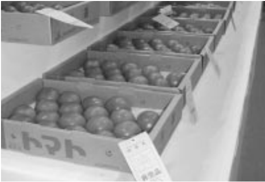
県内の農産物が一堂に展示される