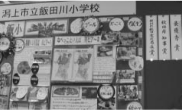
昨年の学校農園展では飯田川小学校が最優秀賞など3賞に輝く

最近の種苗交換会では、農産物を生産することだけでなく、地元で生産された農産物をどのように地元で消費していくかという研究や、農産物を使って生活習慣を見