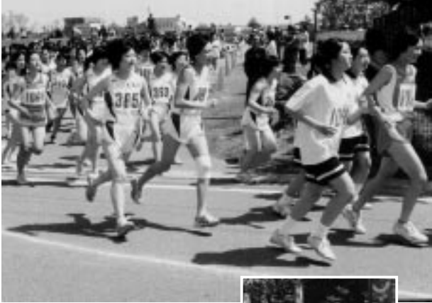
中学生ランナーたちが心地よい汗を流しました