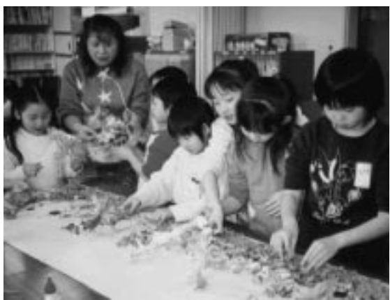
追分地区放課後児童クラブ

保護者の就労などにより、学校から帰っても保護者が家にいない児童を預かり、遊びを中心とした活動を通じて、児童の育成・指導を行い児童の健全育成の向上を図ることを目的としています。今では全国で設置されていて、潟上市でも全六カ所で開設されています。どのクラブでも、外遊びはもちろんのこと、昔遊びや四季にふれあう機会も大切にしています。子どもたちは、自らおやつづくりに挑戦しており、内容盛りだくさんの児童クラブ活動です。