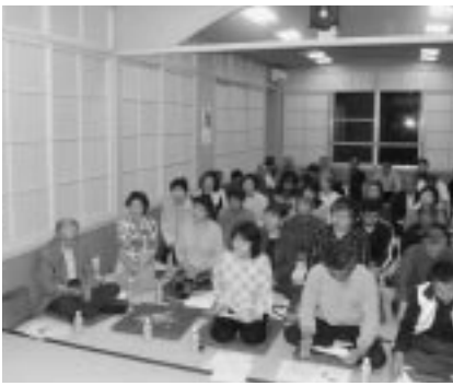
(昭和地区) 中央地区コミュニティ(14の自治会対象) での説明会