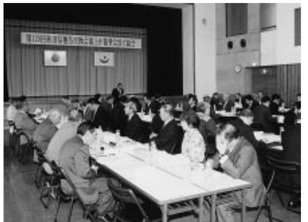
協賛会設立総会（昭和公民館）

協議案件では、事業計画における会場候補地として、農作物出品展示や石川理紀之助翁展、学校農園展などを天王総合体育館（主会場）、JA全農あきた展や農業機械化ショーなどを昭和工業団地（協賛会場）などと計画しています。このほか、キャッチフレーズの募集、ポスター作成、協賛金・広告依頼、農工商フェア・テナント募集、会場駐車場整備などを行い、十一月一日から始まる交換会開催に向けて、本格的に始動することを確認しました。