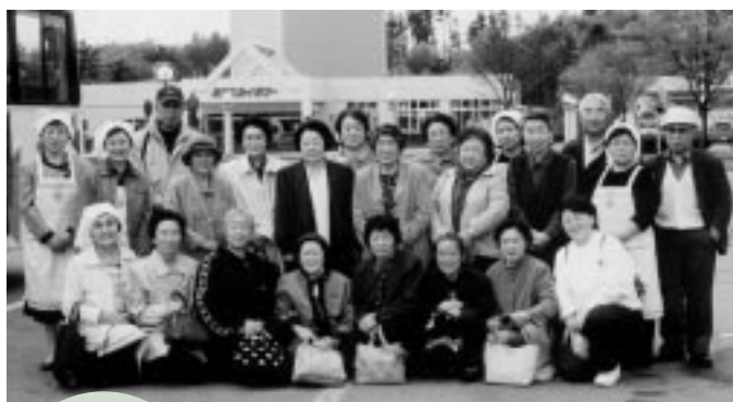
天王グリーンランドで記念撮影