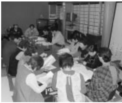
(天王地区) 中羽立部落会での説明会