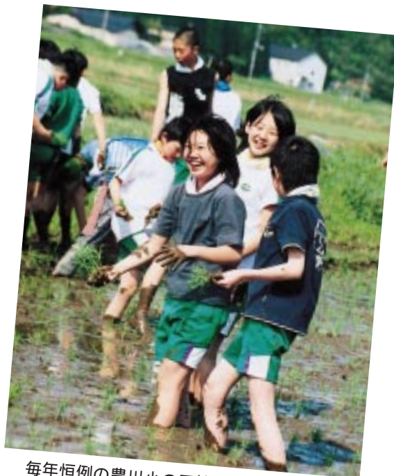
毎年恒例の豊川小の田植え体験。校舎近くの学習田で4年生から6年生が地域の方に手ほどきを受け、にぎやかに田植えを行いました。

慣れない作業に少しとまどっていた子どもたちですが、泥だらけになりながら、笑顔で田植えを楽しみました。