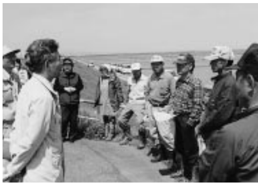
活発な意見交換が行われました（妹川浜集落にて）