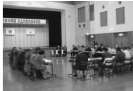
今年度の観光事業などについて話し合われました

総会では、昨年度の事業報告・決算を承認後、今年度の各種事業計画案および予算案が承認され、潟上市の観光事業がスタートしました。