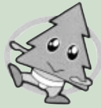
相撲競技 (天王地区)