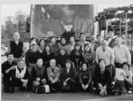
交流会に参加できなかった友人も見送りに来てくれました。（昭和庁舎前）