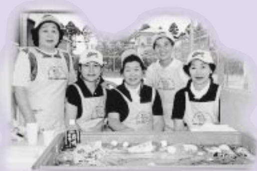
選手・監督を心を込めておもてなし