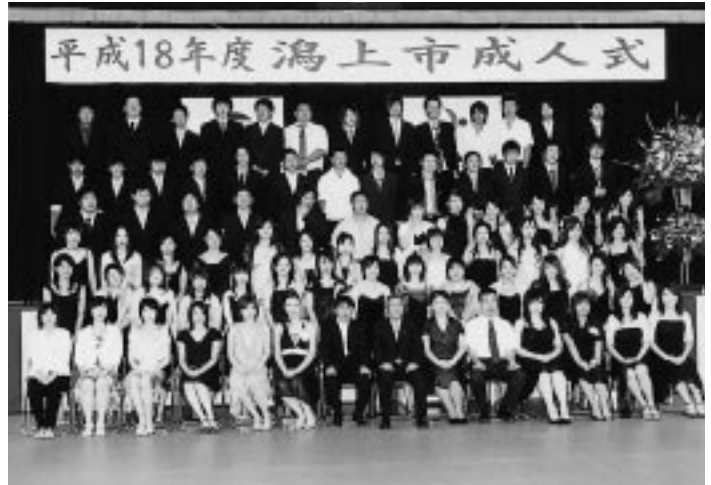
天王・二田・湖岸地区の新成人