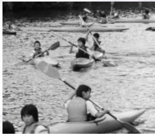
子どもたちの順応性に驚き！水上をすいすい、初めて乗るとは思えない安定したオールさばき