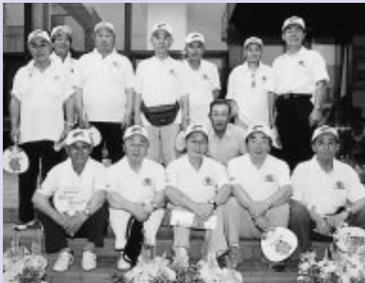
会場環境美化に努めた市民のみなさん

小学生が育てた花壇（プランター）と中学生が制作した応援看板で彩られた会場内では、中学生や市民ボランティアなどがプラカードや誘導、式典・競技準備に汗だくになってがんばりました。休憩所・役員控室などでは、市相撲連盟婦人部や天王婦人会、天王食生活改善推進協議会などが接待し、冷たい飲料水やシジミ貝の味噌汁が提供され、「美味しい！」と大好評でした。 受付案内には天王商工会、仮設テントや臨時駐車場では、交通指導隊や交通安全協会、防犯協会、防犯指導隊、市消防団天王支団第一分団のみなさんが暑い夏空のもとで車の誘導などにあたり、老人クラブ連合会やボランティア団体連絡協議会などのみなさんが、環境美化活動に取り組みました。 猛暑の中での大会準備やリハーサルにはじまり、当日の大会進行、競技式典、休憩所の接待など、市民一人ひとりがまごころ込めたもてなしで大会運営を支えました。 平成十九年秋には、潟上市を舞台に「秋田わか村国体の相撲競技（九月三十日）十月三日、会場・天王総合体育館」、レスリング競技（十月五日）十月八日、会場・昭和体育館）が行われます。潟上市実行委員会では、国体成功への気運を一層高め、市民のみなさんと共に本番に向けての体制整備に努めます。