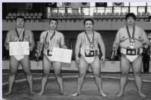
団体準優勝を飾った秋田県チーム

会場内は熱気に満ちあふれる中、地元の中学生や市民ボランティア、各種団体などから多くの市民が大会をサポートし、国体への気運を盛り上げました。