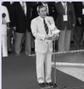
石川光男市長が歓迎のあいさつ