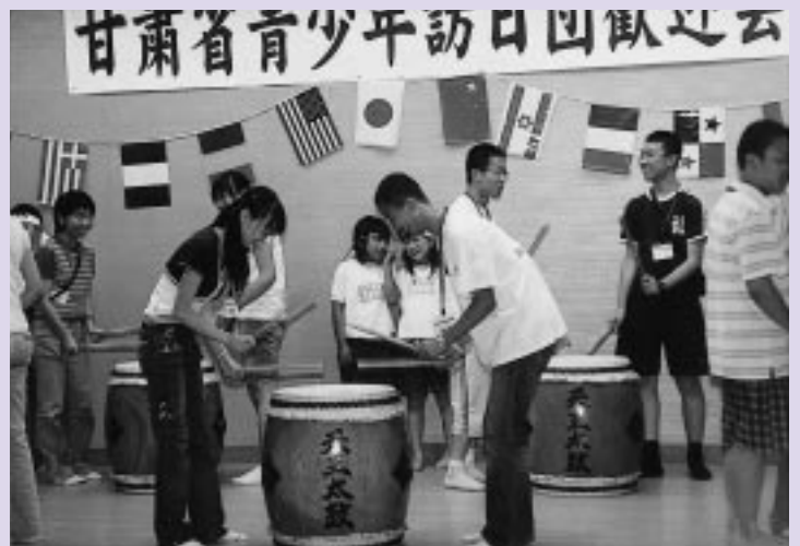
甘肅省青少年訪日団が 市内でホームステイ - 瀋阳市国際交流協会 -