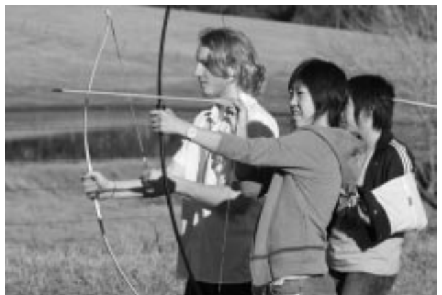
大自然の中で生き生きとファーム体験

第2回潟上市中学生海外ホームステイ体験学習が、7月26日から9日間の日程で行われました。市内の中学2年生12人は、南半球の大陸・オーストラリアの異文化やホストファミリー、現地中学生との交流など、貴重な体験を通じて、国際理解・交流の芽を育みました。