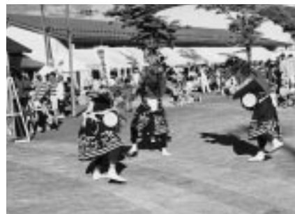
伝承芸能「新関ささら」