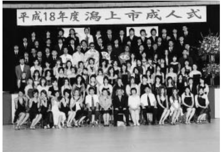
昭和地区・飯田川地区の新成人