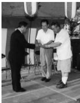
目録が手渡されました

これらの資機材は、あかしや児童公園内に設置された保管庫に収納され、自主防災の体制づくりを積極的に進めてきた両町内会の、さらなる防災意識の高揚や防災活動などに活用されます。