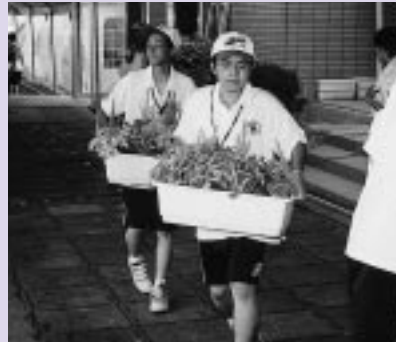
小学生が育てた「プランター」で会場を飾る