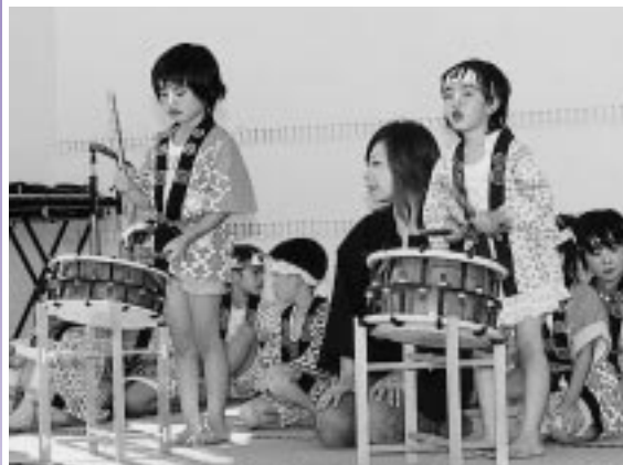
幼児のかわいい太鼓