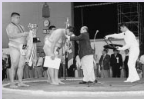
優勝旗は大分県チームへ