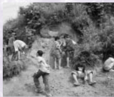
金づちとたがねを使って土（石？）を割って、化石が入っているか確かめます。貝や葉の化石が見つがると、思わず歓声が上がります