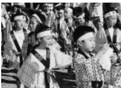
頑張った幼児のみなさん