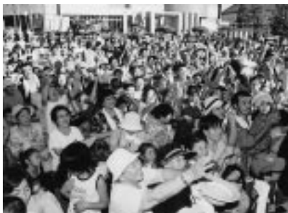
会場は熱気に包まれる