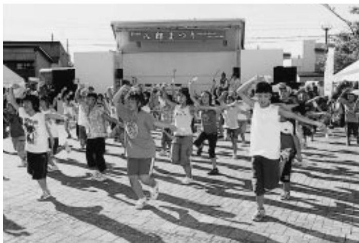
大久保小の「ヨサコイ踊り」

八郎瀉が世紀の干拓事業によって大きく変容し、その湖岸に住み、数々の思い出を残した人々が、八郎湖への郷愁と畏敬の念から、昭和四十二年に『八郎まつり』を誕生させました。 祭りのシンボル八郎龍は、体長六十四メートル、伝説「八郎太郎物語」を具現化したものです。ミスター八郎太郎、ミス辰子を先頭に、八郎ばやしに続いて、八郎龍と辰子龍が若衆に担がれ昭和と大久保地区内を練り歩きます。