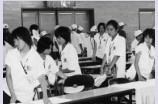
会場整理にがんばる中学生