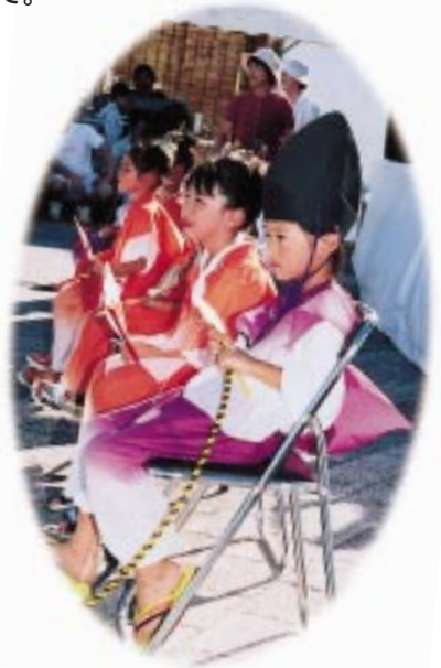
未来のミスター八郎太朗とミス辰子かな?