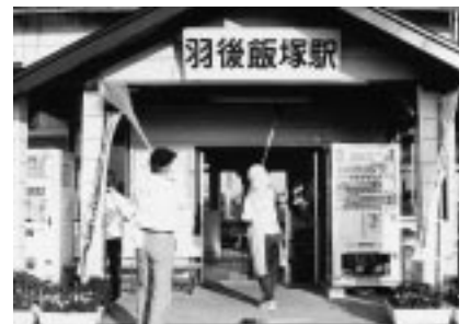
いつまでも美しい駅で

会員らは、「みんなが利用する駅をみんなの手で守るため、今後も清掃活動を続け、多くの人に参加してほしい」と美化運動の参加を呼びかけています。