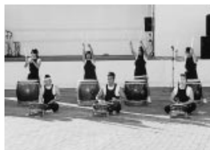
ささら太鼓の演奏