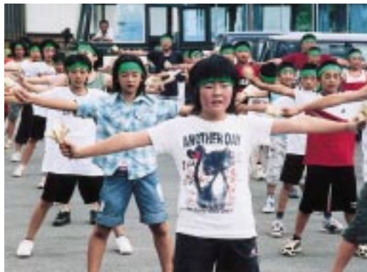
「ヤー!!」ピシッと決まった「ヨサコイ踊り」