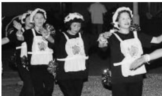
華麗な踊りを披露