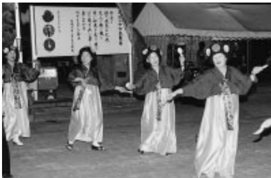
話題の「チャングム」?