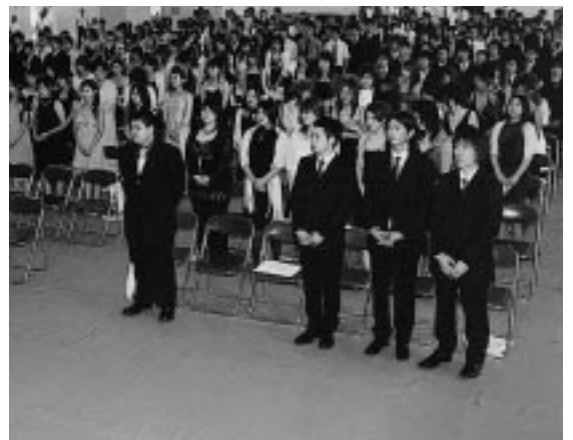
人生の大きな節目を仲間と共に