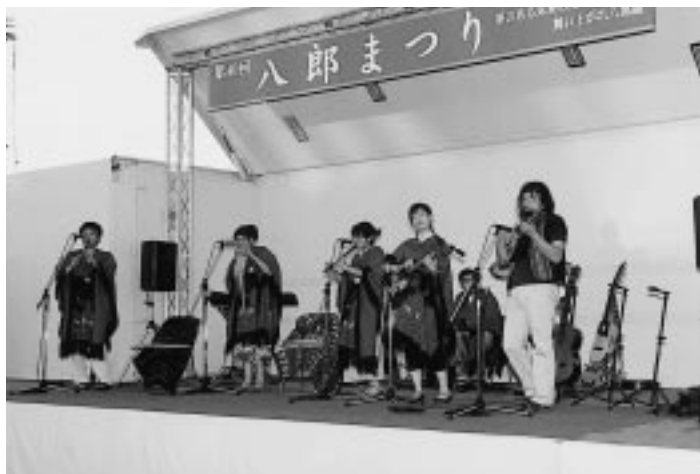
テーマソングを演奏した「ベル・ヴィエントス」のみなさん