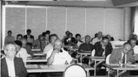
各地区の代議員のみなさん