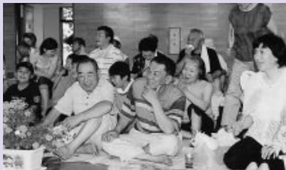
熱戦が続く相撲競技に見入る観衆