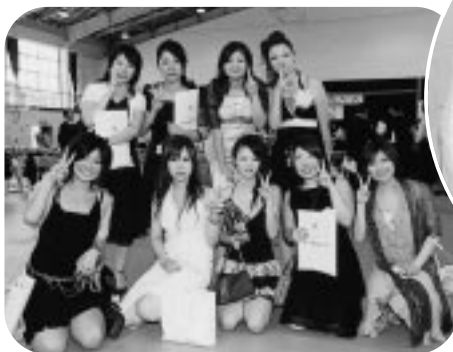
希望に満ちあふれた笑顔がキラリ