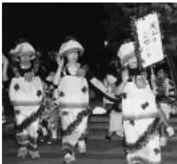
華やかに夜を彩る