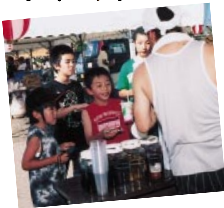
かき氷、おいしいね