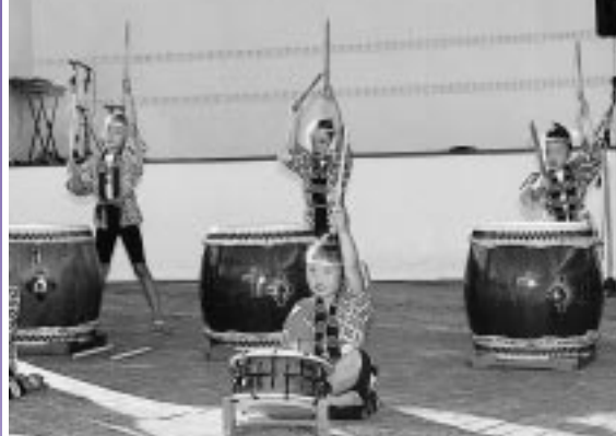
キマッタネ...創作太鼓