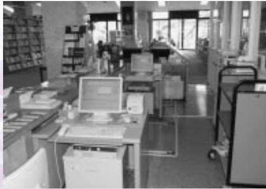
コンピューターによる管理が行われている図書館