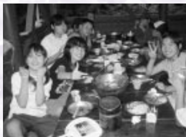
みんなで協力し、完成したカツカレー、味は世界で最高！（冷や）汗と、（煙がしみた）涙のたまものでした