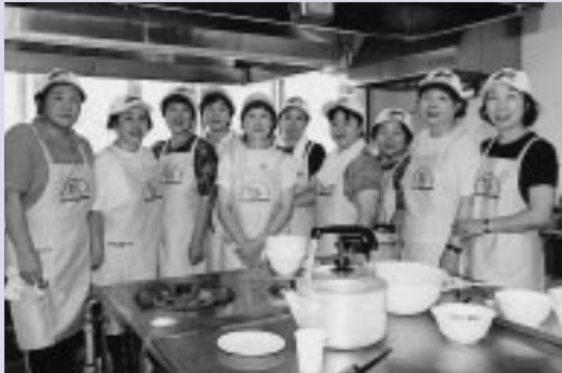
おいしい「シジミ汁」を提供した食生活改善推進委員のみなさん