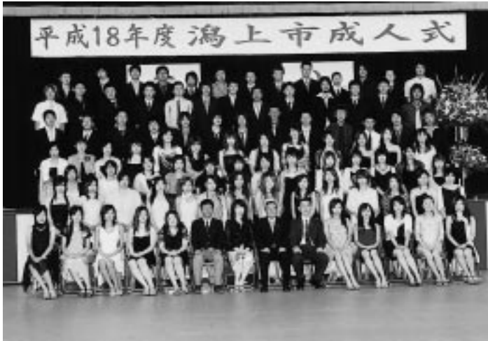
出戸・追分地区の新成人