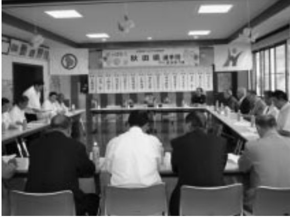
古川民泊協会のみなさんとの説明会

三木市吉川町の富岡地区は、酒米で有名な『山田錦』の産地で、所々に柵田の展開するのどかな農村に見受けられました。約七十戸のこの地区で、二チーム(二二歳)二十一(十一家庭)で民泊を引き受けていましたが、まず民泊に