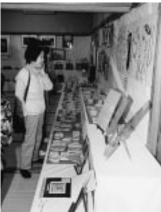
作品展示場にはたくさんの人

夜からは、公民館ホールでダンスパーティーが行われ、各ダンス同好会を中心として、参加者五十六人が華麗なダンスを見せていました。十五日、公民館では各種団体による発表会が行われました。天王中学校生徒による劇に始まり、舞踊、ハルモニカ・ギターの演奏、ジャズダンス、「劇団おらほ」による劇などが披露され、見るものの目を釘付けにしていました。