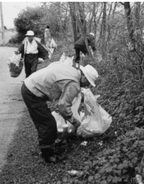
なぜ減らない! ごみの不法投棄とポイ捨て

情報交換会では、日頃のボランティア活動での情報交換と交流を深め、「地域の生活環境は自分たちの手で守る」ことの大切さと、住みよい生活環境づくりを確認し合いました。