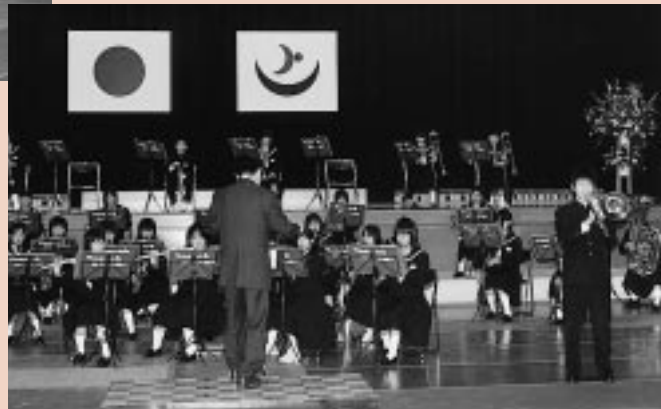
天王南中学校吹奏楽部による力強い演奏