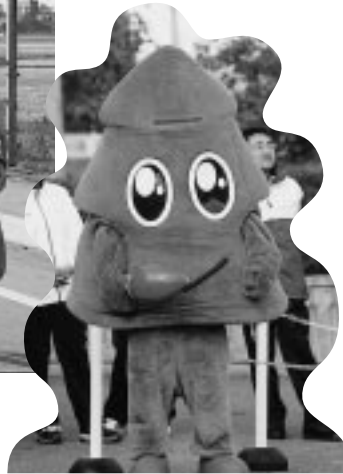
スグッチも応援！がんばれー！