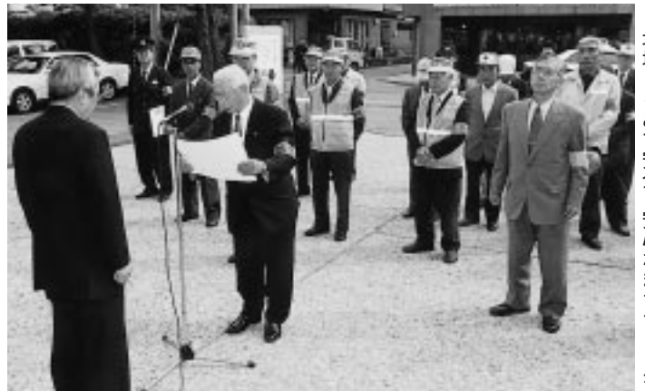
地域ぐるみで安全・安心なまちづくりを

この日、五城目警察署前でキャラバン出発式と防犯功労者表彰が行われ、本市から7人・1団体が表彰されました。表彰された方は次のとおりです(敬称略)。