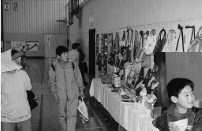
力作・秀作がズラリ