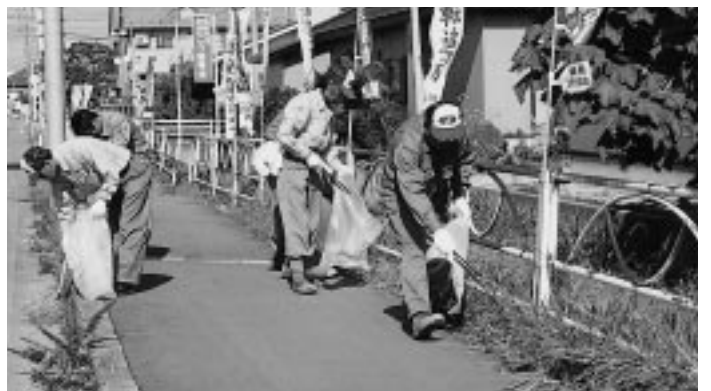
地域のために奉仕活動

当日は、乱橋、新聞、天神下地区の3班に分かれて、道路沿いの空き缶・ペットボトルなどのごみを拾い集め、地域の美化に一役買っています。