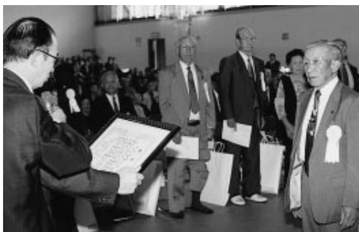
単位クラブ、個人の功労を称える

第3部芸能発表では、35組がステージで踊りや歌、舞踊などを披露し合い、交流の輪を広げました。