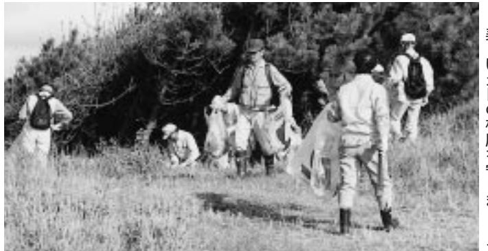
美しい夕日の松原を守りましょう

今後も、美しい「夕日の松原」を守るため、不法投棄を追放し、美しいまちづくりにご協力をお願いします。