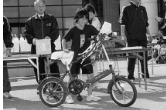
抽選会で自転車をゲット！ヤッタネ