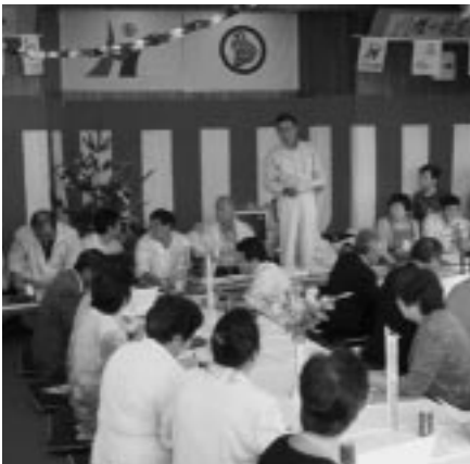
富岡民泊協会のみなさんと情報交換

特に感じたことは、協会の立ち上げの早さ(平成十七年三月)、準備の周到さ(例えば、役員会十二回開催、地区単独調理実習五回など)、住民との連携(独自の「民泊協会だより」発行、地区名の入ったユニホームの全戸配布)などです。いずれにしても、メンバーのみなさんは明るく生き生きと動き回っていました。今回の視察を参考に、地域住民との連携を深めながら、特に構えることなく、久しぶりに帰ってきた子どもたちをもてなす気持ちで取り組みたいと思います。