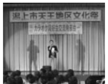
カラオケ同好会交流発表会