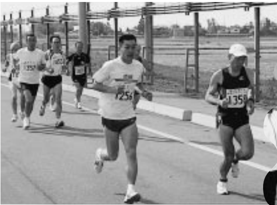
マラソン愛好者が秋路を快走