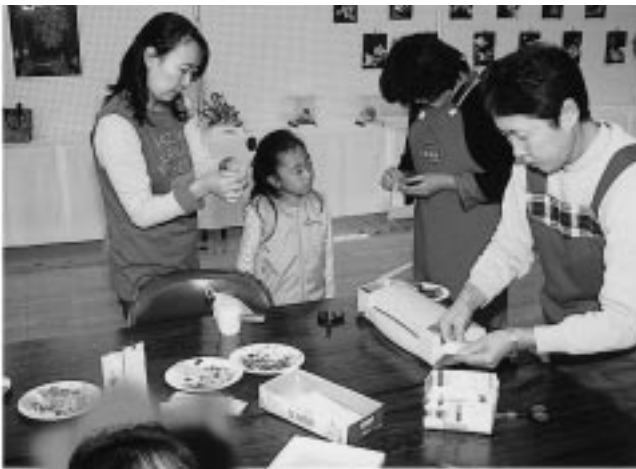
キーホルダーづくりに興味津々

体験コーナーでは、押し花、スライムづくり、プラ板でのキーホルダーづくりを行い、多くの方々が挑戦