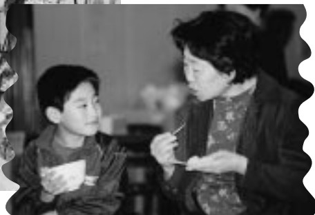
お茶をおいしくいただきました

芸術・文化の秋。潟上市では各地区で文化祭が行われ、写真や陶芸などの作品展示、団体や個人による芸能発表など、日ごろの活動の成果を披露しました。 また、十月十四日には音楽祭、十五日には文化講演会が行われ、たくさんの方が会場を訪れて、芸術文化を肌で感じていました。