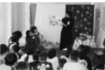
童話の会主催によるお話の広場