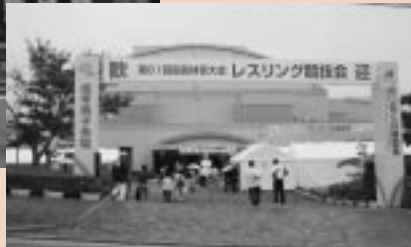
猪名川町のレスリング競技（成年男子）会場を視察