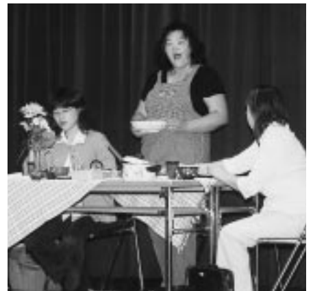
男女共同参画についての劇を披露「劇団おらほ」