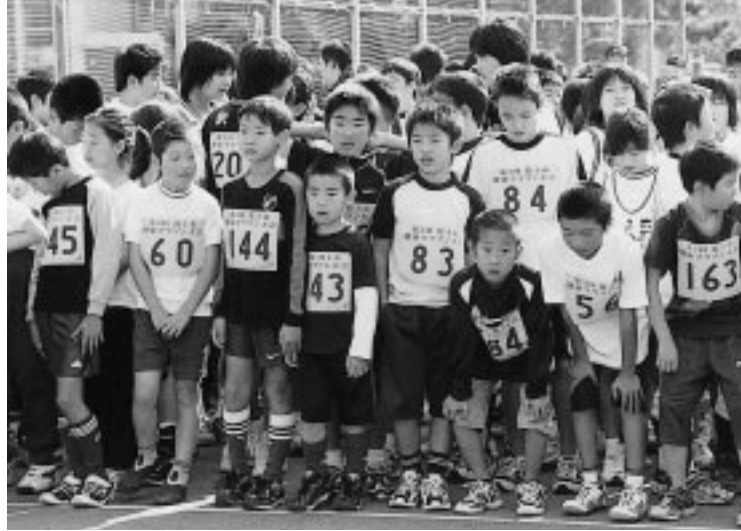
スタート前には小学生が大集合！ドキドキ・ワクワクの瞬間...