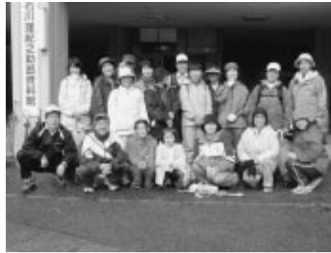
みんなで歩いてニッコリ笑顔

していました。また、茶道のコーナーでは、お点前の実演で来場者をおもてなし。また、婦人会による「おふくろ食堂」のだまこもちも大人気でした。八日には、文化祭に合わ