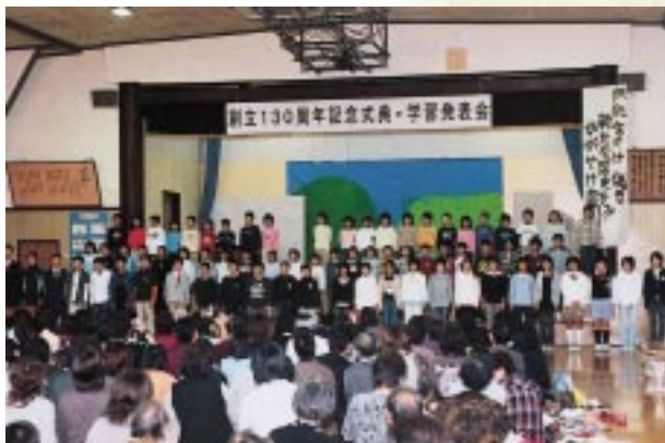
みんなで新たな歴史への誓いのことばをよびかけました