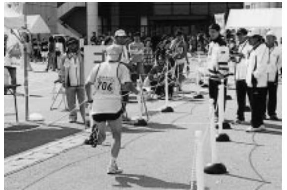
すべてのランナーが完走！いい汗を流しました