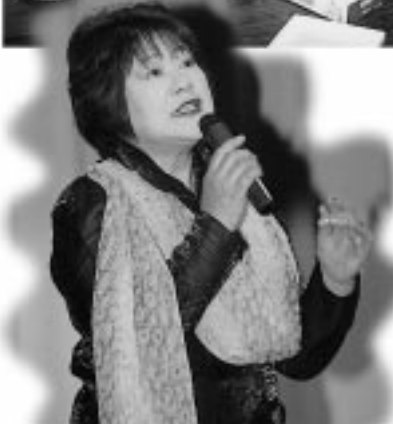
すてきな歌声に会場はうっとり

していました。また、茶道のコーナーでは、お点前の実演で来場者をおもてなし。また、婦人会による「おふくろ食堂」のだまこもちも大人気でした。八日には、文化祭に合わ