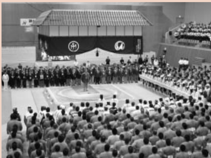
相撲競技会場に全国の強豪が参加