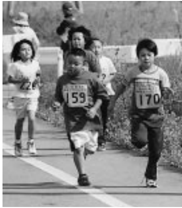
お互いがんばろうネ！