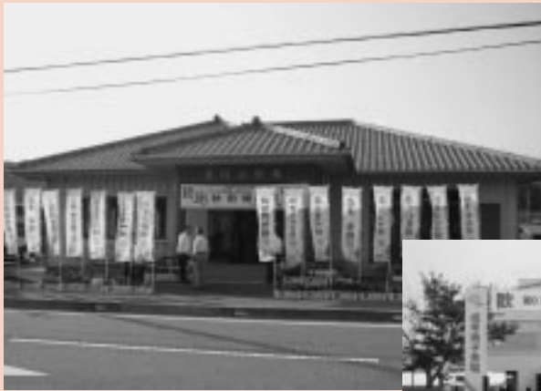
三木市古川地区の民泊拠点施設前には歓迎の“のぼり”で秋田県選手を迎える