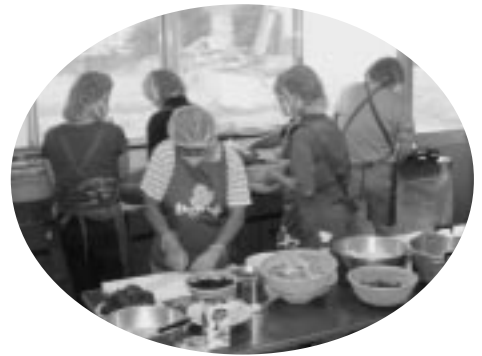
富岡民泊協会では調理班が食事準備に大忙し