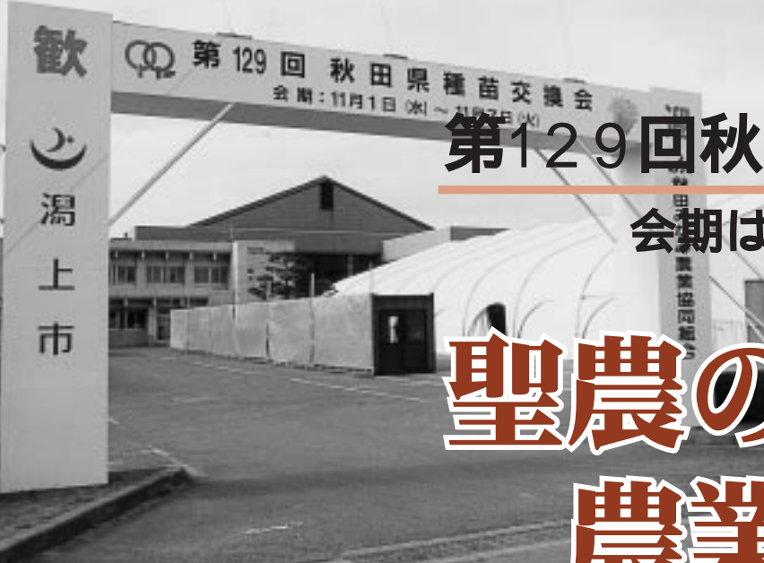
主会場となる天王総合体育館