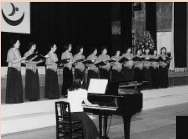
市内のコーラスグループが息の合った美しいハーモニーを奏でました

第三部では、県内有数の部員数と優れた演奏で名高い県立新屋高校吹奏楽部約六十人のみなさんが演奏。力強くも優しく、リズムカ