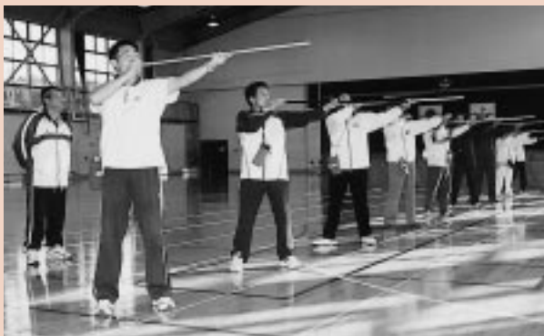
各地区の体育指導委員が技術を習得