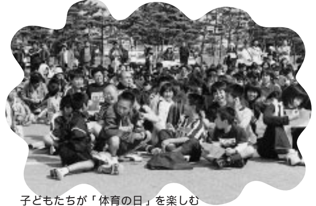
子どもたちが「体育の日」を楽しむ