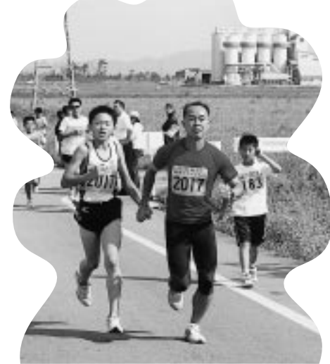
息のあった親子ランナーがゴールをめざす