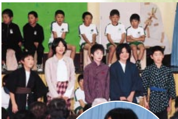
3・4・5年生が秋田の国の物語を演じました