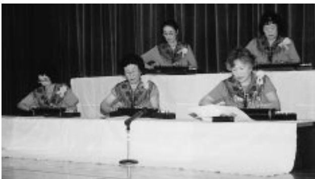
大正琴サークルによる演奏

このほか、婦人会やJAW女性部による食堂コーナーでは、うどん・そば・だまこもちなどの料理が振る舞われていました。