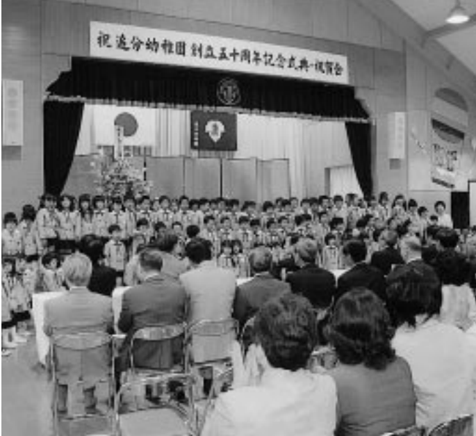
半世紀にわたる歴史を喜び合う