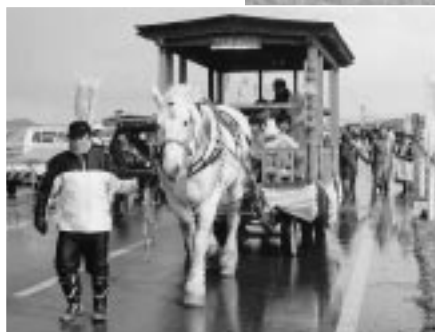
昭和愛馬会の馬車も大好評