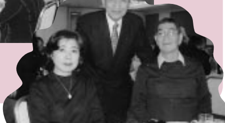
和やかにふるさとを語る