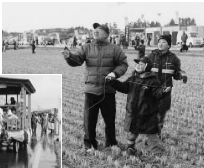
家族で凧あげを満喫