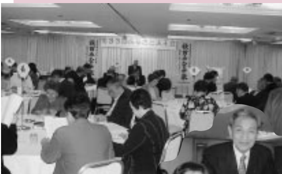
会員80人が参加し、再会を喜び合う

最後に、JA協賛のお米や小玉醸造(株)協賛の味噌などを手土産にして、来年の再会を誓い合いました。