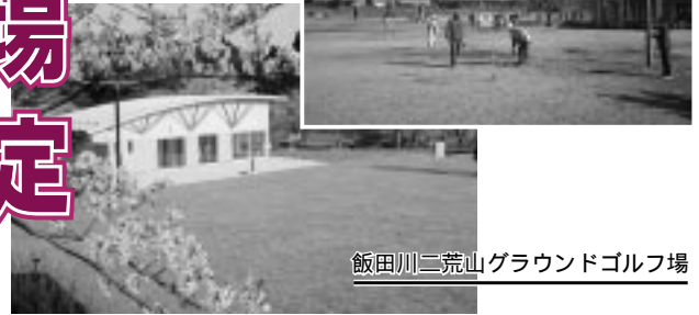
飯田川二荒山グラウンドゴルフ場

なお、天候によってオープン日時が変更になる場合がありますので、あらかじめご了承ください。