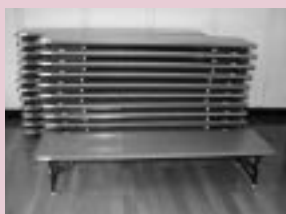
軽くて使いやすい座卓

座卓（25台） テーブル（10台） イス（65脚） 冷蔵庫 テレビ 炊飯器（2台） オープンレンジ 放送設備（ワイヤレスアンプ） テント ほか