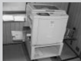
資料づくりなどに活用される印刷機

印刷機 太鼓 冷蔵庫 テレビ オープンレンジ テント（2張） 放送設備（ワイヤレスアンプ） ガステーブル（2台） バドミントン支柱・ネット ほか