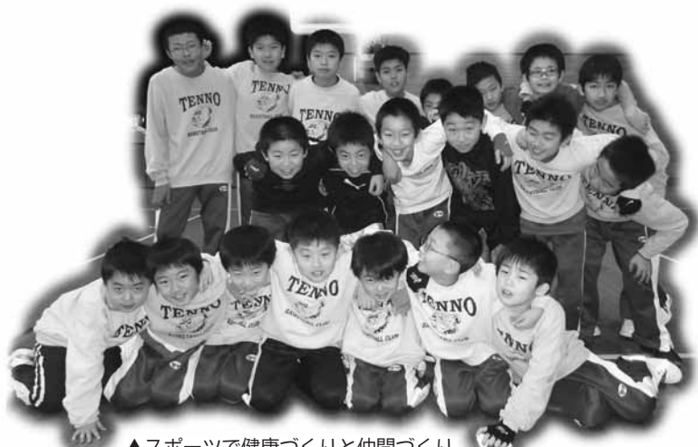
▲スポーツで健康づくりと仲間づくり

また、昨年12月18日、天王南中学校体育館を会場に「8人制バレーボール大会」を開催し、地元小学生から一般まで13チーム・総勢132人の