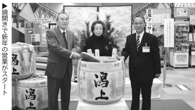
鏡開きで新年の営業がスタート

この日は甘酒無料サービスなどがあり、市内外から訪れたたくさんの人でにぎわいました。