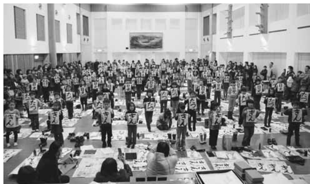
納得の1枚を手にとって

書き上げた作品は、1月10日まで同公民館に展示され、訪れた人の目を楽しませました。