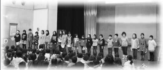
▲こども実行委員の皆さん

こども実行委員が登場キャラクターを紹介した後、命の大切さと友情を描いた映画「シャーロットのおくりもの」が上映され、参加した子どもたちは、楽しいひとときを過ごしました。