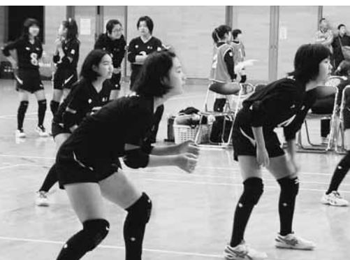
▲次世代を担う子どもの可能性を応援 （潟上天王）