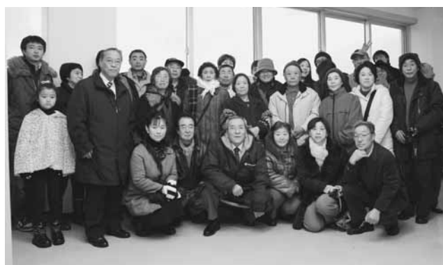
石川市長を囲んで記念撮影

この日は天候に恵まれ、2012年の初日の出を期待して訪れた市民など約130人が参加。午前7時5分頃、展望室東側に見える出羽の山並みからオレンジ色に輝く太陽が姿を現すと「きれい」「今年は良い年になる」などと歓声が上がり、一緒に訪れた家族や仲間と共に、新年の夢や希望を願っていました。