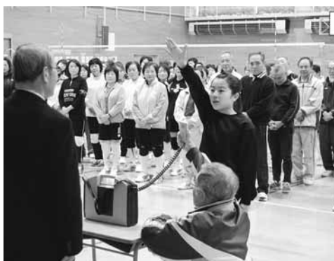
▲スポーツで世代間交流（潟上中央）

県内では、すでに51クラブが設立され、設立準備委員会を組織している11団体を合わせると、総数62団体が多様なスポーツ事業を展開し、日夜活動しています。