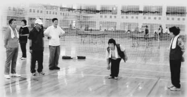
▲屋内ペタンクでエンジョイ、スポーツ!!

会員の気が向いたときに、都合に合わせて運動できる機会を増やすことで、気軽にさまざまな種目に参加し、健康・仲間づくりができるようになりました。