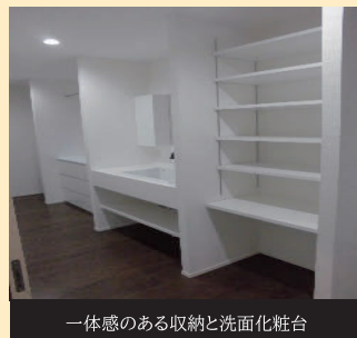
一体感のある収納と洗面化粧台