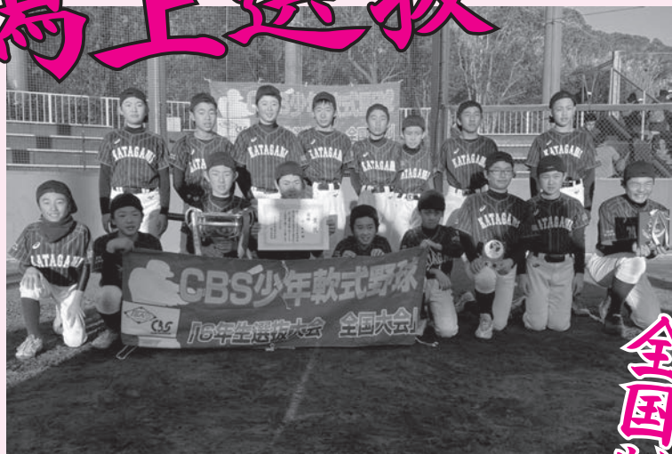
▲全国制覇した潟上選抜の皆さん