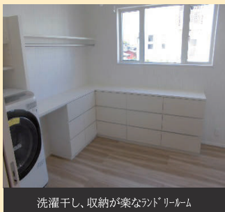
洗濯干し、収納が楽なランドリールーム