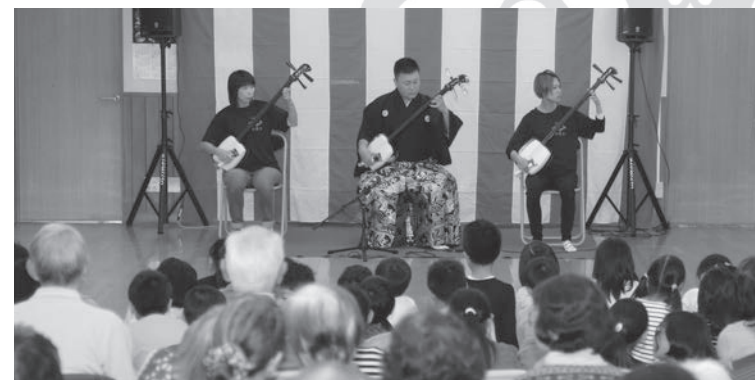
▲地域交流会でお弟子さんとの演奏

れています。 ――三味線を見たところ、ギターのようなフレットが無いのですが... どこでどういう音が鳴るか、勘所は自分で覚えなければなりません。 ――お弟子さんは何人いますか？ 今は7人です。小学生から60代と幅広い年齢層の方が習われています。 ――教室はどこで開かれていますか？ 自宅月に2回行っている。