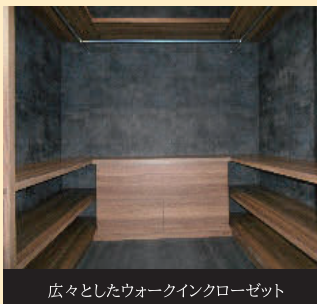
広々としたウォークインクローゼット