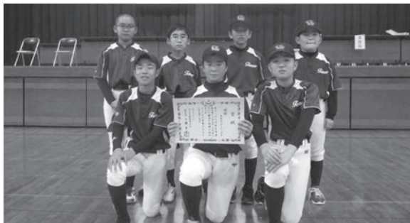
▲優勝した天王ヴィクトリーズA