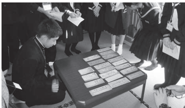
▲夜学生の子孫にあたる方から資料を見せてもらいました