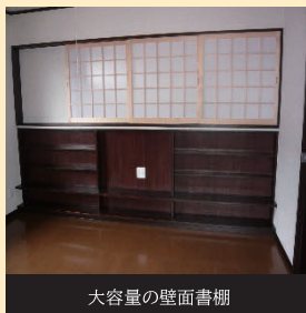
大容量の壁面書棚