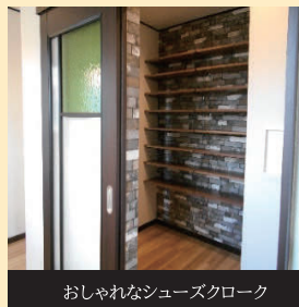
おしゃれなシューズクローク