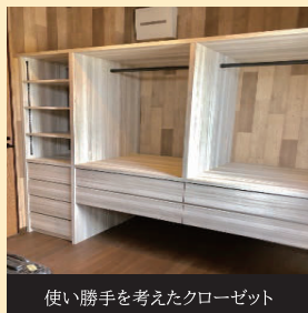
使い勝手を考えたクローゼット