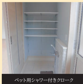
ペット用シャワー付きクローク