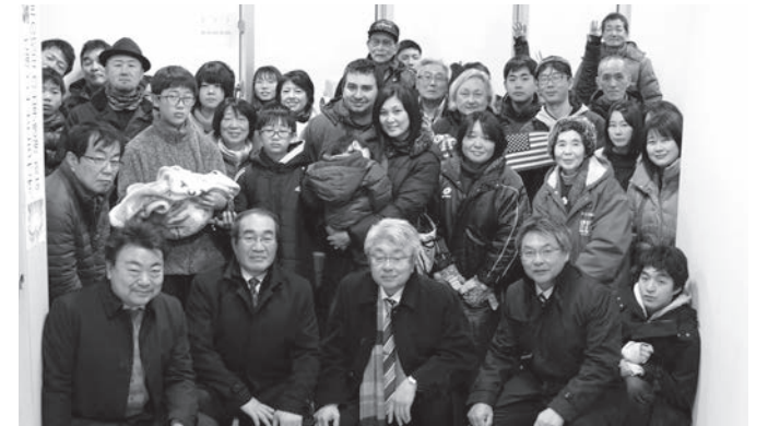
▲令和初の新年の幕開けを喜び合いました

1月1日、天王グリーンランドスカイタワー展望台に、初日の出を眺めようと市内外から家族連れや友達同士などが訪れました。この日は曇り空であったものの、期待を捨てずに初日の出を待ちました。その後も雲はかかったままで、残念ながら初日の出を見ることは出来ませんが、早朝の空気が澄んでいる中、新年の訪れを家族や友人と喜び合い、清々しい一年の始まりとなりました。