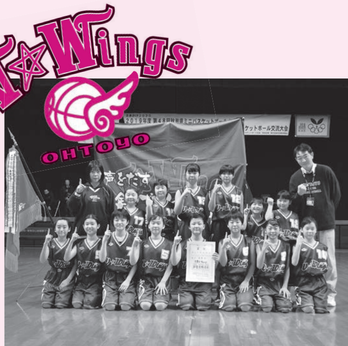
▲見事、初優勝を飾った女子の大豊 V-Wings