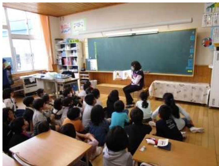
（読み聞かせサークルによる読み聞かせ）