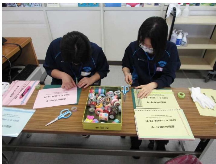
（中学生による職場体験（キャリア・スタート・ウィーク））