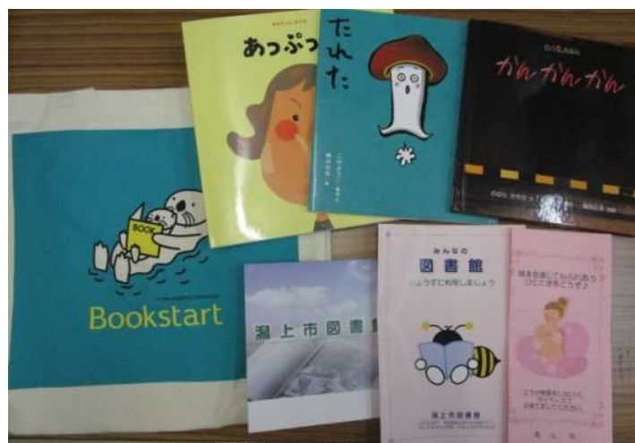
（ブックスタートパック）