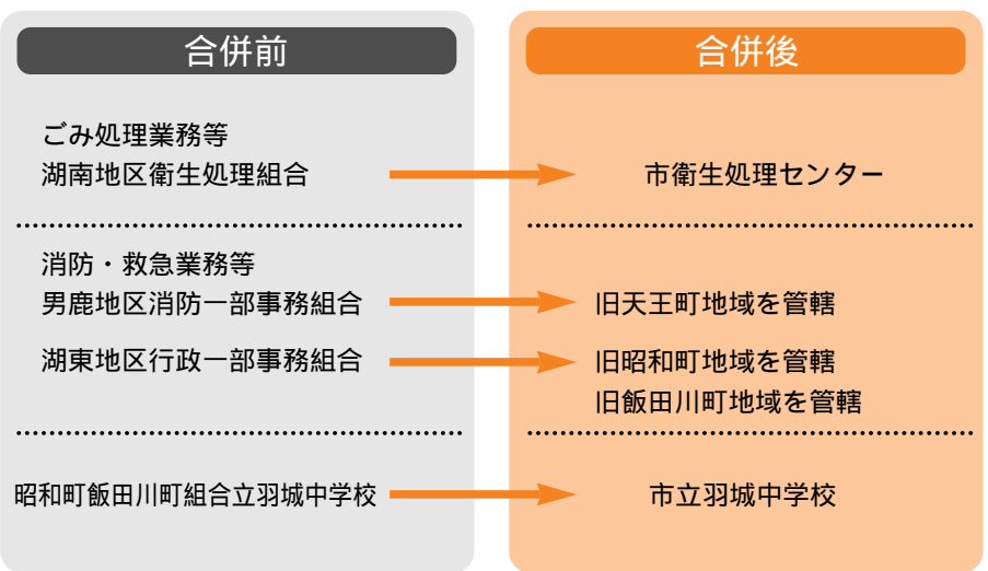
想定される具体的パターン

必要な時期までに議決または、決定を得るための議会を招集するいとまがないと認める時、首長が議会に代わって、案件を処理すること。