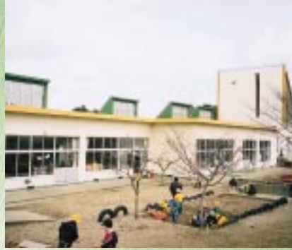
天王町追分保育園