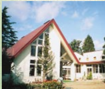
天王町 私立追分幼稚園