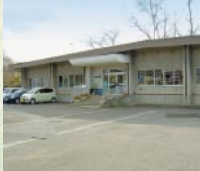
天王町追分乳児保育所