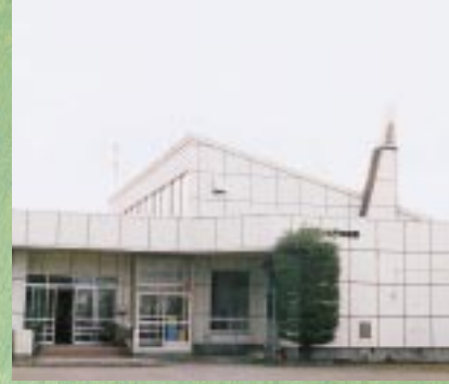
天王町出戸幼稚園