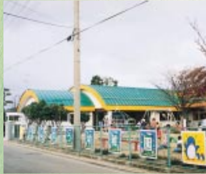
天王町天王幼稚園