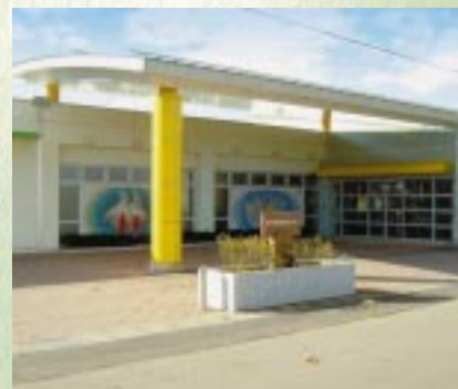
飯田川町若竹幼児教育センター