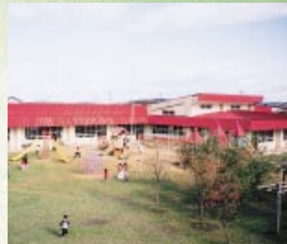
昭和町中央保育園