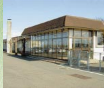
天王町湖岸保育園