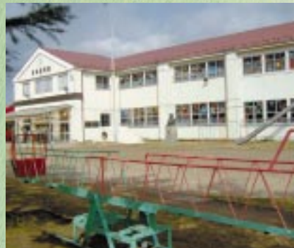
天王町 私立東湖幼稚園