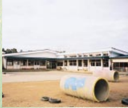
天王町二田保育園