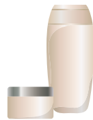
乳白色の化粧品のびん