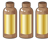
ドリンク剤のびん