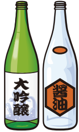
一升びん (酒・しょうゆなど)