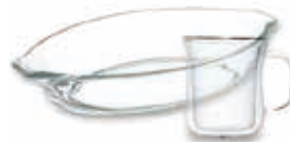
耐熱ガラス製調理器