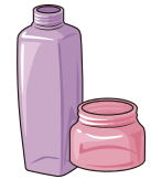
化粧品のびん (乳白色以外)