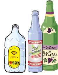
ウイスキー、ワインなど 酒びん