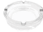
クリスタルガラス製の皿・灰皿など