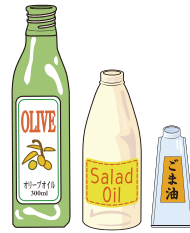
ドレッシング、 サラダ油のびん