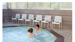
露天ジャグジー風呂