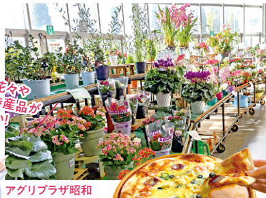
アグリプラザ昭和