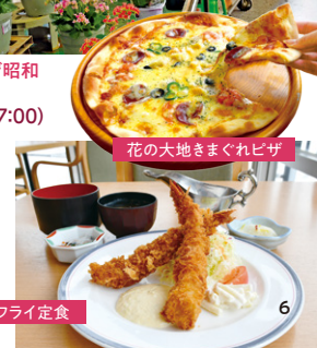
花の大地まぐれピザ