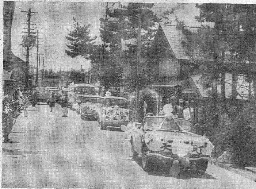
新産都市指定祝賀パレード

秋田湾地区が六月一日の閣議の内定により、追加指定を受けましたことを第一に祝福し、現在迄、これが実現に努力されてまいりました。正し、後進性を脱却し、西日本の