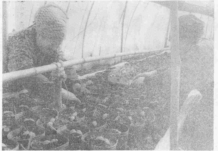
ツギ芽をしたキウリを植えかえる下出戸ビニールハウスで

鎖一本雪と遊べぬ白い犬 文字細く返書にツヤの春早し 春の雪女ごころの解けし夜 春ふな(鮎)を焼くクリヤよ り子守歌 指のかず齡い重ねて人園児 土間の内かがやき春の農具み がく