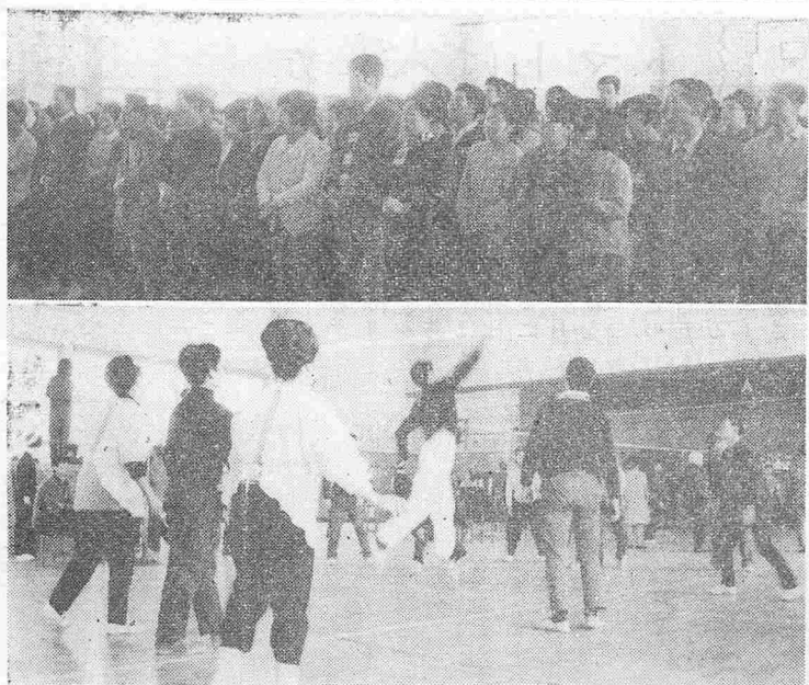
開会式での選手たち(上)と大ハツスルするオクさん選手たち(下)

破れて多少しおれるチーム、明暗さまざまだったが、だれもかも、ひごろの仕事の疲れをいやした快い気分になり、楽しい二月の家庭の日だった。当日の成績は次のとおり。