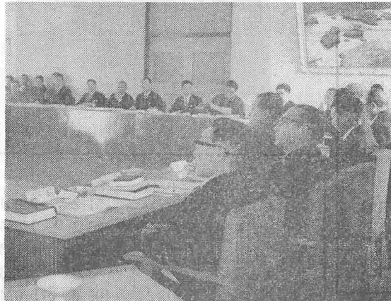
新議員による初議会

新議員による初の町議会(臨時)は一月十八日に開かれ、新しい議長、副議長、常任委員など議会人事を決めたほか、選管委員の補充員、監査委員を選び四十一年度一般会計補正予算案を原案どおり可決して同日閉会した。