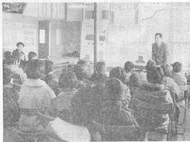
「児童の質問に答える町長

二月二十日の午前中、役場に天王小の三年生の児童百四十五名が訪れた。社会科の教科書にでてくる役場のはたらきについて、実際に目で確かめようとする日の見学になったもので追分小に次いで二回目。職員案内で事務室、議場、会議室などを回りしたあと、町長にいろいろな質問をあげせ