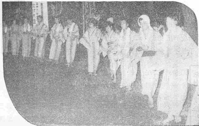
盆踊りも夏の風物詩の一つ。あのタイコの音も来年までもう聞けない。（二田神社で）

学校プールの完成は、夏休み中の子どもたちにとって最高のおくりものだった。子どもたちは毎日元気に水シブキをあげていた。