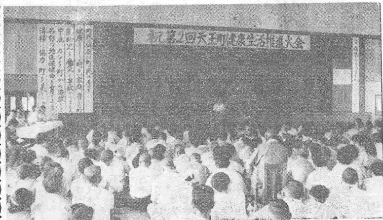
関係者五百二十人が集まつて開かれた第二回大会

は長寿の町天王を建設しようとして誕生したもので、県内ではもちろん初め。全国でも岩手県と岡山県の一部で組織されている。結成当時から各方面の注目を集めさらに大きな期待が寄せられているが、地区保健会が母体となつて、着々とその実績をあげている。 ひとくくりに長寿の町を建設するといつても、そこまでの道のりは長く、問題も多いが各部会がそれぞれの分野を担当して活動しており、各種の検診や病氣予防を始め、環境衛生の向上などいろいろの面にその成果があらわれている。 しかし、本格的な活動は二年目になっています（が必要ですが。納付書をなくさないように、日ごろの管理にご注意ください。 ▼納税組合は、皆さんの税金を役場に納めるための大事な存在です。日常の組合活動が早く正しく行なわれるよう、自分の所属する組合の組合長や役員には、積極的に協力しましょう。