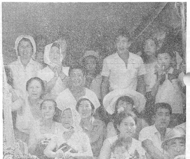
珍競技、迷選手に思わず顔をほころばす応援団。