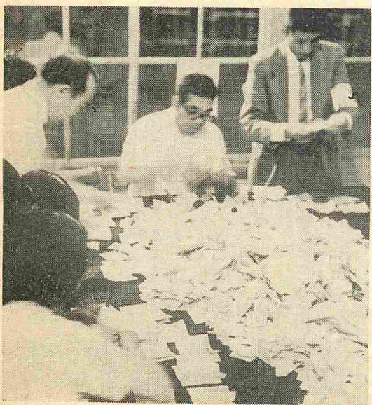
七月七日行なわれた選挙開票風景

できる汚物は、なるべく自から処分するようにとめるとともに、自分から処分しない汚物についても、食物の残廃物、その他のごみを各別の容器に集めるなど、町の行なう汚物の収集及び処分協力するとともに、町で指定した場所に投票してください。