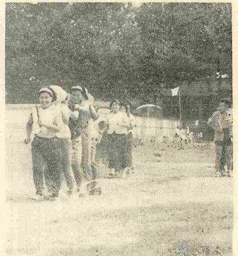
▲「百足競走」(二田部落で) 調子をそろえて左、右、左、右