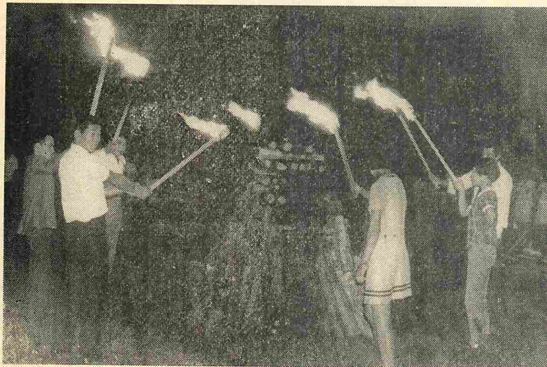
▲「友情」「協力」「信頼」「平和」「団結」「自由」「建設」 七つの火が夜空に輝く

「新成人」の門出を祝う町成人式は、八月十五日町公民館において行なわれた。これまでは一月十五日に成人式を行なってきたが、みんなが軽装で気軽に出席できる夏にという新成人たちの強い希望で、来年一月の成人式を繰り上げたもの。 ことしの新成人は三百五十一人で、このうち二百二十五人が出席した。男は半袖シャツ、女はワンピース姿が目立ち、おとなへの自覚も新たに若さと夢がいっぱいだった。 式は午後三時から始まり、新成人者の確認が行なわれたあと、町長の「若さと純真さ