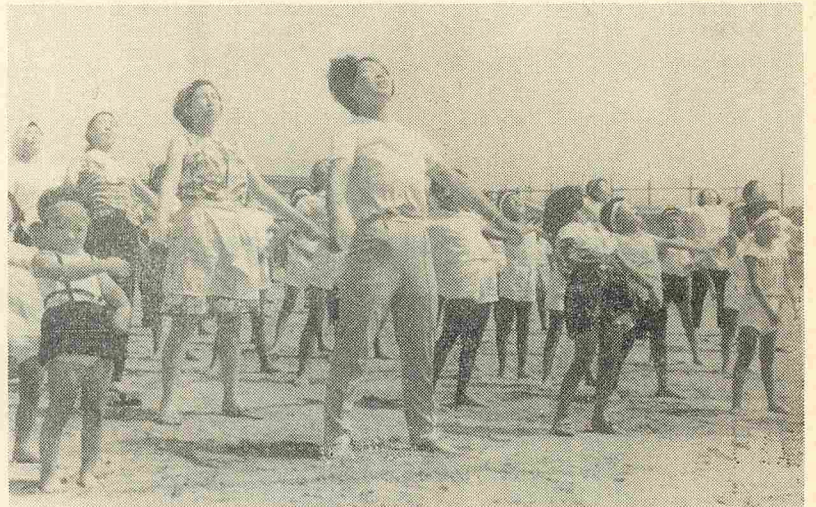
▲「準備運動」酸素がなくならないように深呼吸してください(塩口部落で)