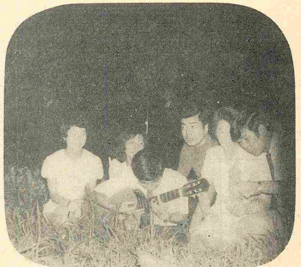
▲ギターをひき、歌を歌う。 キャンプファイヤーの楽しいひととき。