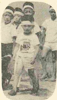
▲僕も選手です(羽立部落で)