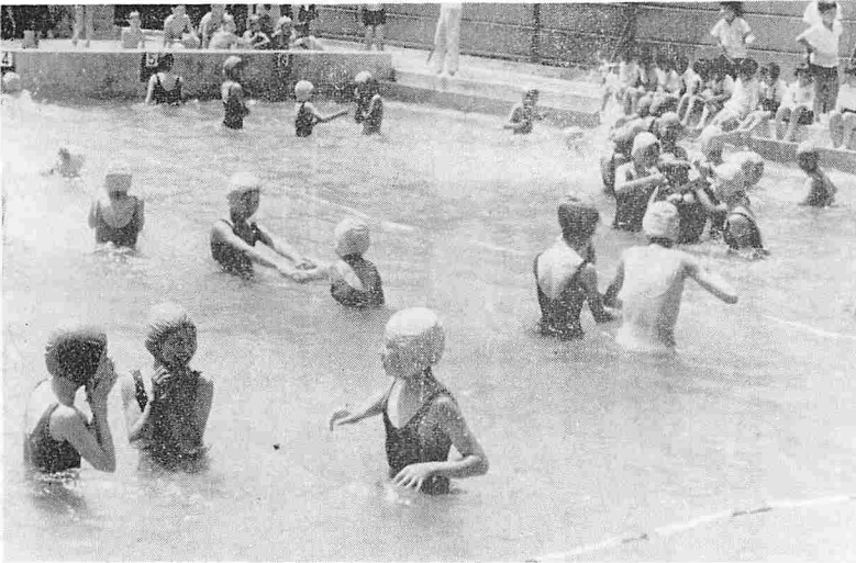
新しいプールで初泳ぎ(東湖小プール)