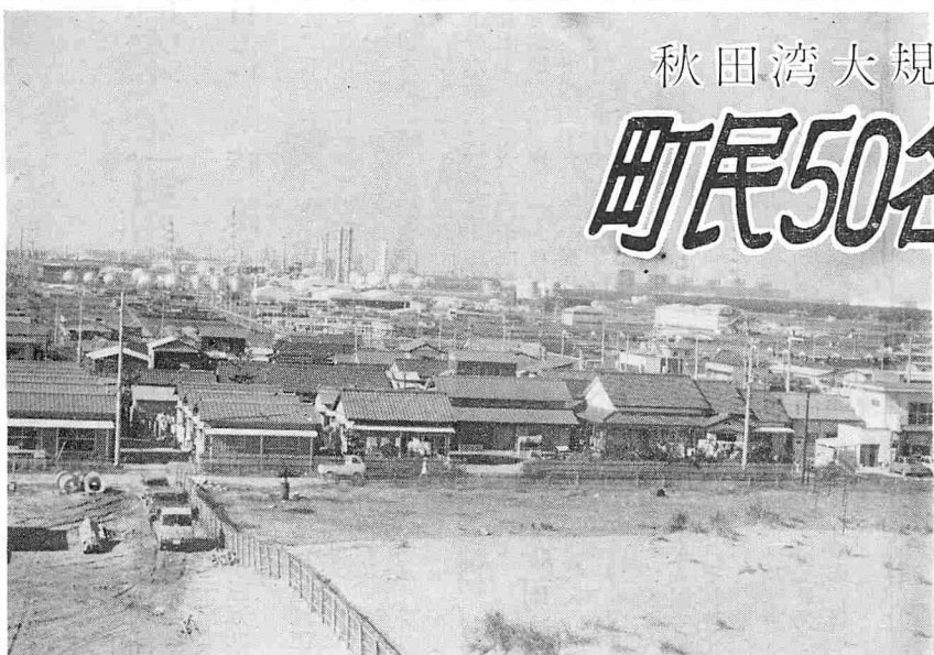
▲鹿島知手住宅団地から石油コンビナート、鹿島火力発電所を望む(昨年写す)