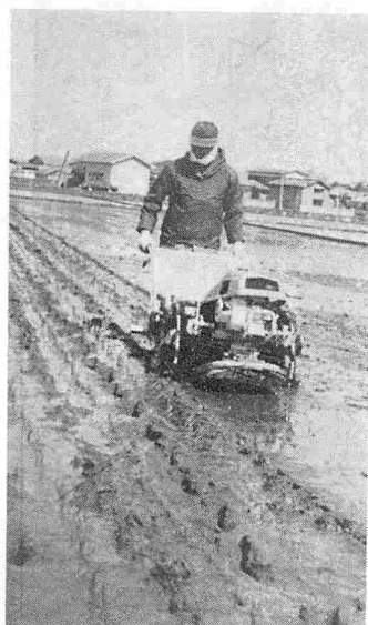
▲田植え機械の導入も年々伸びている

現在、本町でも天王地区の七台を最高に合計二十四台の田植え機械があり、昨年に比べ二倍の増である。