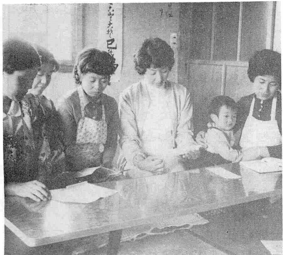
▲材料は何が必要ですか、調理実習の前に説明を受ける婦人たち。(渋谷生活学級)

通信教育は生涯学習の最上の制度で、いわば社会人学校といっても過言ではありません。家庭にありながら、又職場で働き