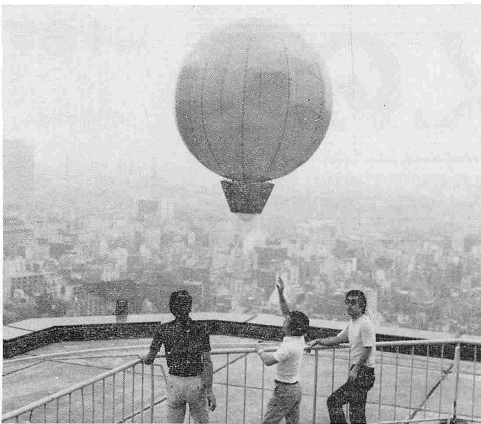
この気球を発見した時はすぐ連絡を

秋田湾地区の工業開発計画を進めるにあたって、大気環境の状況を把握しておく必要があるため、広域的な気象条件調査を昨年度から気象庁及び県で実施してまいりました。この調査の一環として地形、気象条件等が低気層気流の流れにどのような変化を及ぼすか、その状況を調査する流跡線観測を行うことになっております。この流跡線観測のため直経一・五メートルのノンリフトバルーンといわれる赤色の気球を放球することになります。 この気球の下部には、温度計や気圧計などの計器を内包したケースが附属してありますので、