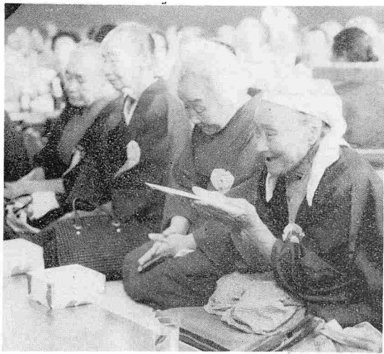
敬老祝金を手にしてニッコリ

食物の生産期日は、七十五日から九十日ぐらいで、秋田から比較すると、小さなものしか生産されていない。我々団員を大歓迎してくれ、国境を越えた交流の場であった。と、農業、公害について報告。