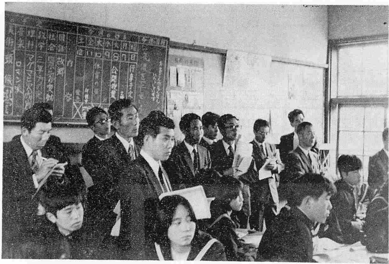
▲ 魅力ある学校づくりを..... 研究授業での一コマ

十月三日に臨時町議会が開かれ、三案件を原案どおり可決して同日閉会した。可決されたものは請負契約関係三案件で、湖岸地区の総合運動場建設工事は四千四百八十八万円で仙台の西松建設、持谷地区の畑地総合整備の用排水路工第二期工事は一千九百十万円で天王の村山組、蒲沼(江川上谷地)の日立秋田の工場用地の西側に設置される排水路工事は、一千三百八万円でむつみ造園建設にそれぞれ決まった。