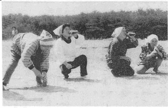
サー一等だ！ 三軒屋部落運動会

去る、四月十八日、晴天のなか、三軒屋部落運動会が服装学院グラウンドにおいて行われた。小部落ながら、全部落民総参加のもとに午前中のひとときを笑い、かけ声で過ごした。三軒屋部落では毎年春に魁がけて行われており、百パーセント？近い人たちの参加で、親子リレーやジュニアのみ競走で楽しい一日を過ごし、部落の親睦と明日への英気を養っているものである。