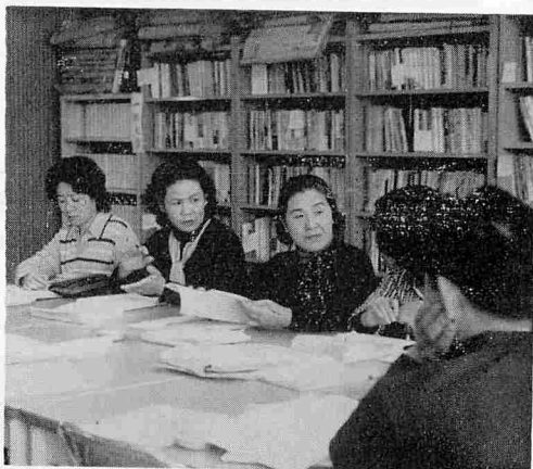
審査の方々も一苦労

町公民館では、昭和五十二年の読書感想文を募集していたが、二百十五編が応募され、昨年の応募総数百七十編を大きく上回り「本」に対する関心の高いことを示していた。