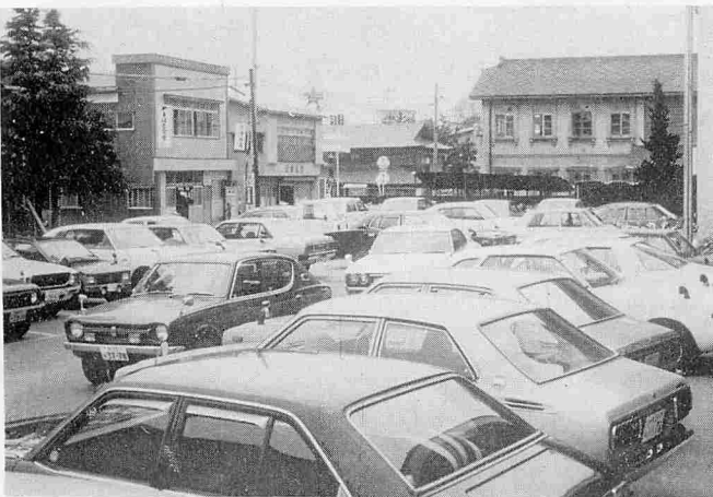
混雑も緩和される役場駐車場