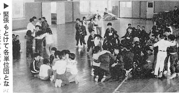
緊張もとけて各単位団とながて限りなく伸びる自分の力を作り出し、友情と協力を学