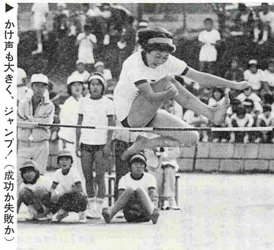
天王地区小学校 陸上記録会開かる 十月九日、天王小学校グランドを会場に、第十七回天王地区小学校陸上記録会が開かれた。