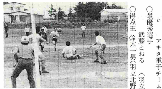
▲ 激しい攻防が繰りひろげられた決勝戦

必ずしもベストとはいえないが、泥にまみれながらも好ゲームが展開された。 初戦各チームともリズムにのれず一進一退のゲームが続いたが、走り回って体がほぐれてくると果敢なプレーを展開。Aブロックでは、羽立チームがパスワークのうまさを見せ、相手チームに得点を許さず決勝に進出。