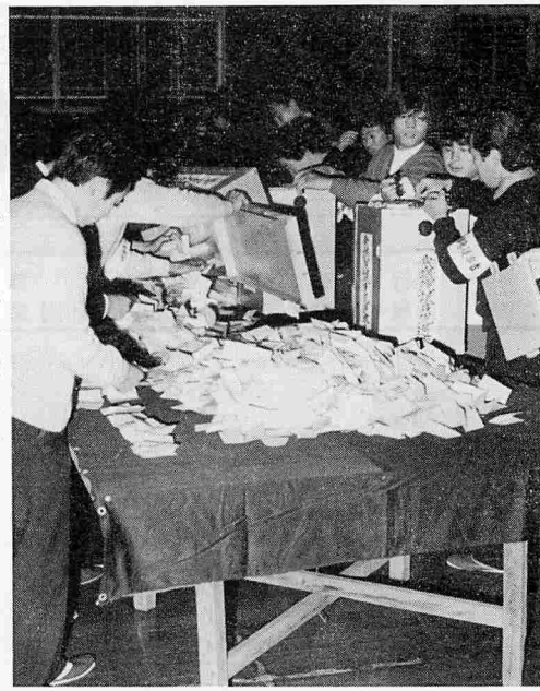
衆院総選挙の開票風景(町公民館にて)

第三十五回衆議院議員総選挙および最高裁判所裁判官国民審査が十月七日に行われた。衆議院は、九月七日に解散、総選挙は九月十七日に告示、五氏が立候補し、近年にない小選挙戦となった。