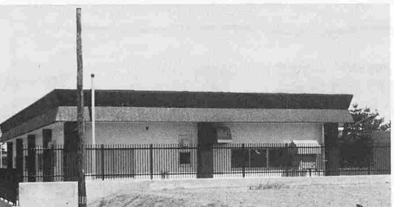
モダンな追分簡易水道源地