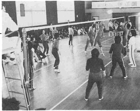
△スパイクも強烈に！(アウトかセーフか?)