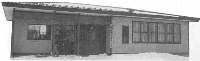
連日にぎわいをも せる渋谷地区転作 改善センター

「お客さんに自分たちで作った物をすすめ、おみやげにも持たせてやりたい。」と目を輝かせてこれからの抱負を語ってくれた。