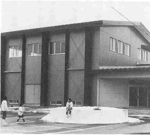
△ 補修要望のあった分館(上) 同一敷地内にある出戸地区コミュニティセンター