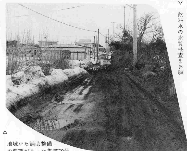
△ 地域から舗装整備の要望があった集道70号