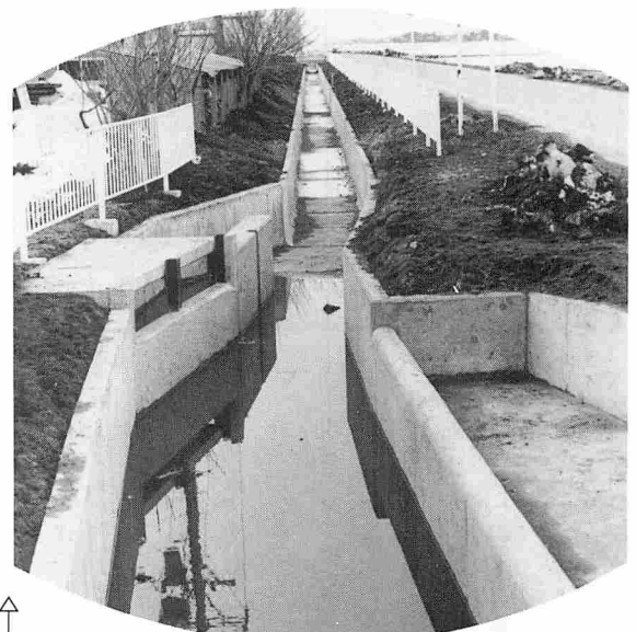
事故防止用フェンスの設置された第一号幹線水路