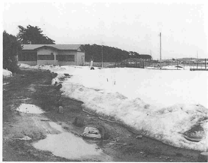
漁港への連絡道路と併わせ児童館周辺の整備が待たれる