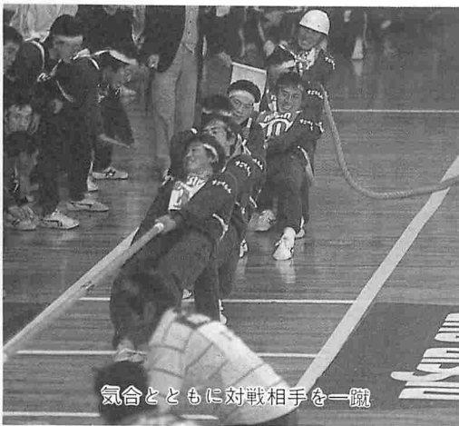
気合とともに対戦相手を一蹴

一月二十日、男子一八チームが出場して、秋田県綱引き大会が行われ、本町のすごえもんチームが、並いる強豪を打ち倒し堂々の初優勝を飾った。