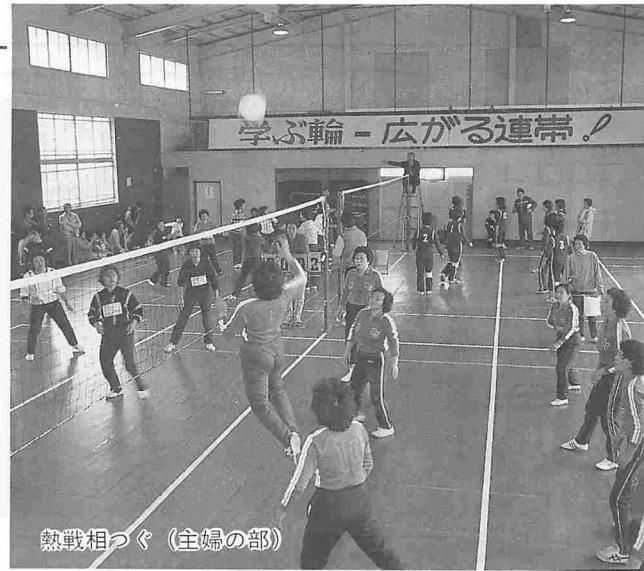
熱戦相つぐ (主婦の部)