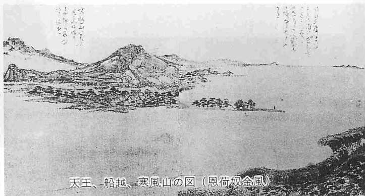
天王、船越、寒風山の図 (恩荷奴金風)