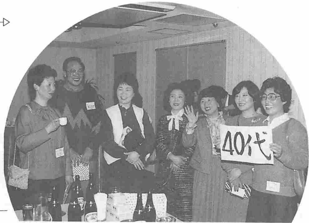
ふるさとのみなさん元気でですか？

なごやいだムードいっぱい2月2日「ふるさと天王会」が東京日本青年館を会場に行われた。