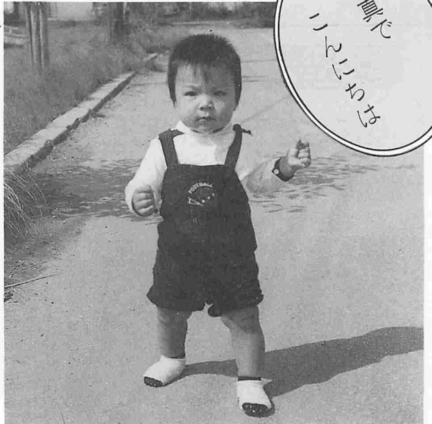
「写真でこんにちは」コーナーでは、みなさんからの写真提供をお待ちしています。(☎78-2211広報係)

やんちゃ盛りの子ちゃん(一才)。握りこぶしもがつつりとガッツポーズで「こんにちは！」